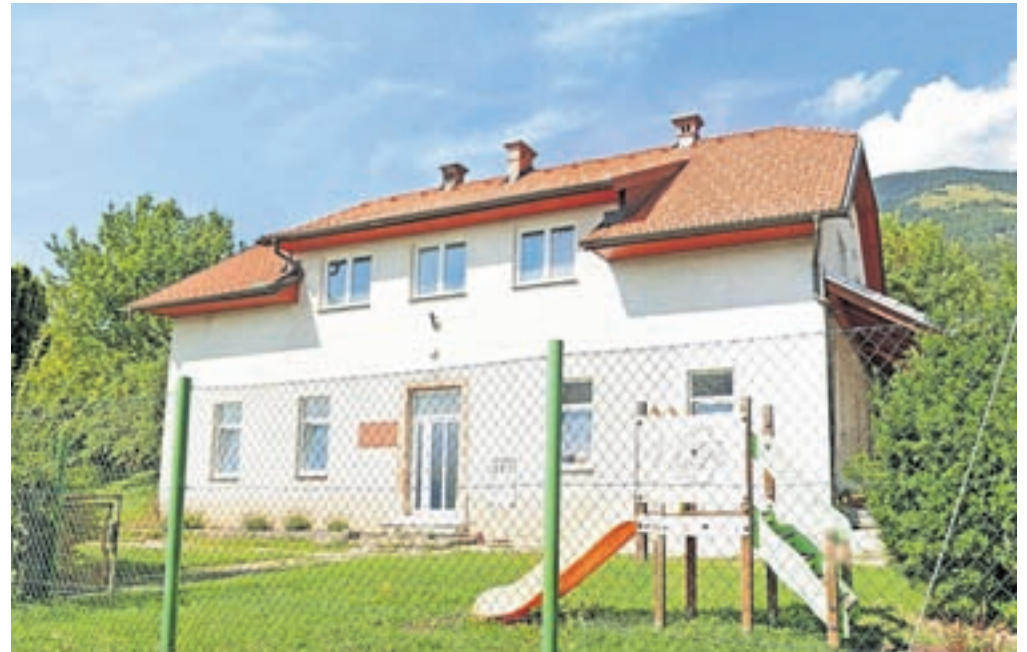
Iščejo uporabnike in investitorje za prostore stare šole.