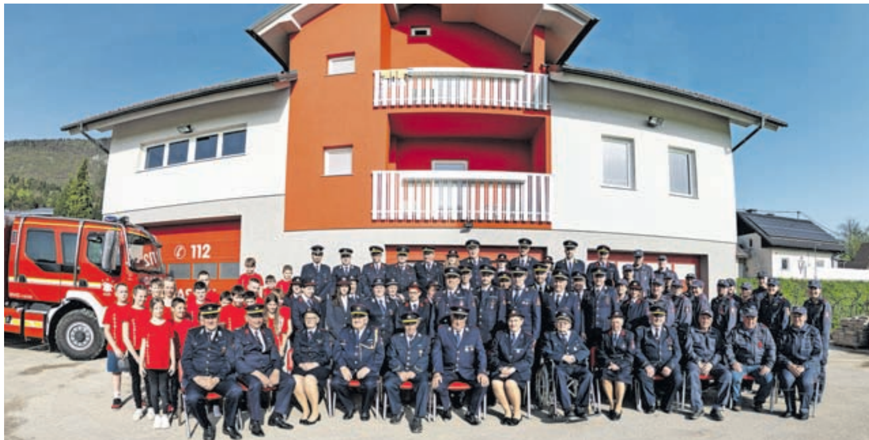
Kriški gasilci zbrani v jubilejnem letu

Tudi letos pripravljamo prvomajsko kresovanje na Polani nad Križami, in sicer 30. aprila. Glavno praznovanje 100-letnice društva bo 8. junija, ko bo skozi vas Križe potekala velika gasilska parada, za zaključek pa se bomo povесelili z ansambлом Modrijani.