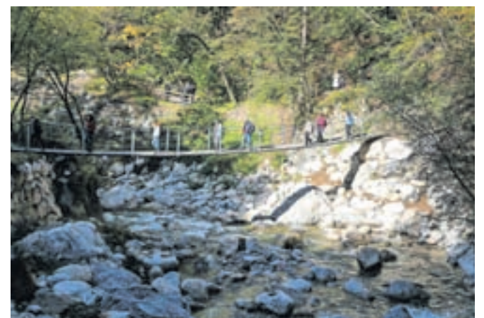
Tudi zaradi lastne varnosti pa hodimo le po odprtih urejenih poteh.

konglomerata, čez katere si reka utira pot v živahnem slapišču. V Dovžanovi soteski kamninska sestava in tektonski elementi kot pravi šolski poligon oblikujejo površje in rastlinstvo, vplivajo pa tudi na življenje člove-