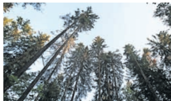
Iz podatkov popisa izhajajo glavni podatki o gozdnih fondih – lesna zaloga in prirastek.

Tržič – Kot je pojasnil vodja tržiške krajevne enote Zavoda za gozdove Slovenije Aljaž Černe, bodo letos izvajali dve vrsti meritev: opise sestojev in izmero drevja na stalnih vzorčnih ploskvah (SVP). »Pri opisih sestojev se na terenu popiše stanje gozdov, gozdovi s podobnimi lastnostmi pa se združijo v sestoje. Vsakemu sestoku se izmeri lesna zaloga, popišejo se drevesne vrste in drugi parametri ter določijo potrebne ukrepe v naslednjem desetletnem obdobju. Izmera drevja na SVP pa poteka tako, da se na stalnih vzorčnih ploskvah v izmeri 2 in 5 arov periodično na vsakih 10 let izmerijo določeni parametri dreves, kot so drevesna vrsta, premer, višina, socialni položaj, kakovost, mrtva biomasa, posek. Iz podatkov popisa SVP izhajajo glavni podatki o gozdnih fondih – lesna zaloga in prirastek.«