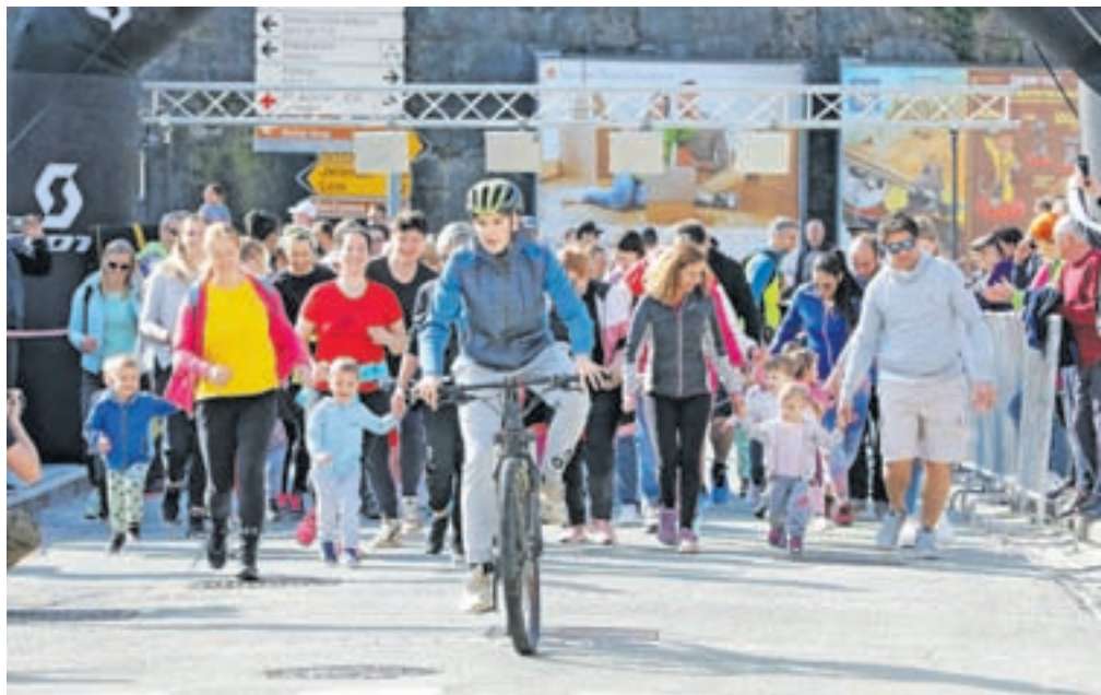
Tek so začeli s skupino otrok, ki so skupaj z vzgojiteljicami iz vrtcev in starši premagali tristo metrov.