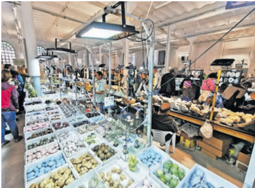
Leta 2022 so Minfos preselili na novo lokacijo, v obnovljeno dvorano BPT Tržič.

širili na tri dni, povečali so tudi površine razstavnih prostorov v prenovljeni dvorani BPT, kjer bo razstavljalo 105 razstavljavcev iz Slovenije in enajstih tujih držav. Društvo prijateljev mineralov in fosilov Slovenije, njihov stalni partner, bo pripravilo strokovno razstavo Fosilna flora ter sulfidni minerali. Obiskovalcem bodo na voljo številni spremljajoči dogodki in doživetja. Že v petek, 10. maja, se bodo vrata osrednjega razstavnega prostora odprla ob 10. uri, istega dne ob