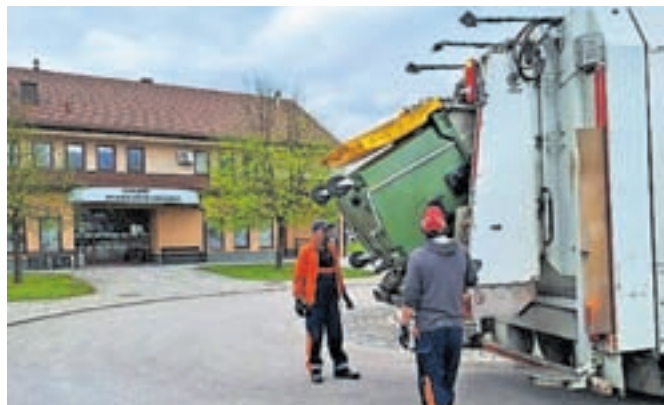
Po informacijah, ki jih na Komunali Tržič prejemajo s terena, so občani Naklega s storitvijo odvoza odpadkov zadovoljni.

Tako v Naklem kot v Tržiču v aprilu poteka akcija zbiranja kosovnih odpadkov iz gospodinjstev. »Naročila odvoza smo sprejemali do 12. aprila, zaradi večjega števila naročil pa bodo odvozi predvidoma potekali še do konca meseca oziroma do realizacije vseh naročil. Uporabniki sicer lahko tudi izven organiziranih terminov za odvoz kosovnih odpadkov te sami pripeljejo v zbirni center v času njegovega obratovanja,« so še pojasnili na Komunali Tržič.