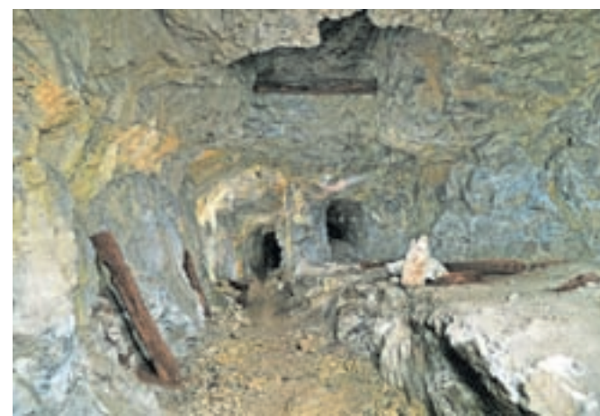
Raziskovanje zgodovinskega konteksta Šentanskega rudnika

Na Občini Tržič verjamemo, da bo ob trdem delu skozi prihajajoča leta v Šentanskem rudniku zaživel Podzemni doživljajski park Sveta Ana ter postal ena izmed vodilnih turističnih atrakcij naše regije. To bo pribežališče vseh ljubiteljev narave, kulture, kulinarike in adrenalina.