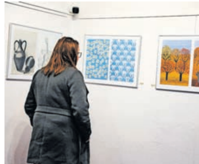
Po stezicah Osnovne šole Bistrica se iskri tudi na likovnem področju.