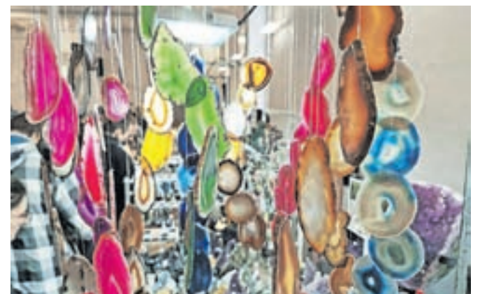
Stojnice prodajnih razstavljalcev z mednarodno udeležbo so že tradicionalno paša za oči, tudi letos napovedujejo pestro ponudbo predvsem naravnih in obdelanih mineralov.