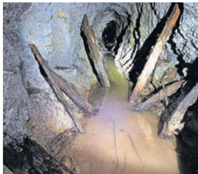
Z odstranitvijo nevarnega odvečnega materiala se bo v Julijevem (odvodnjevalnem) rovu odprla pot za preučitev možnosti vodne atrakcije.

Interaktivno razstavo Šentanski rudnik – raj pod nami bomo odprli v ponedeljek, 6. maja, ob 18. uri v stolpu BPT ob počastitvi 50-letnice Minfosa. Prvič si bo moč ogledati predmete, najdene v rudniškem sistemu in njegovi okolici. Potekal bo tudi natečaj za poimenovanje velike izkopne dvorane.