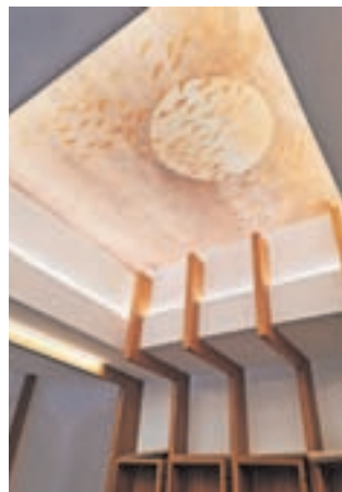
Popolnoma obnovljeni mrliški vežici na pokopališču v Tržiču

Mrliški vežici na pokopališču v Tržiču sta popolnoma obnovljeni, vključno s čajnimi kuhinjami, pri obnovi pa je bilo treba, kot so pojasnili na občini, upoštevati zahteve zavoda za varstvo kulturne dediščine, kot so ohranjen zunanji videz vežic, vrata in konstrukcije. Na mrliških vežicah so zamenjali in izolirali streho, obnovili sanitarije in prostore pogrebne službe (pisarna in skladi-