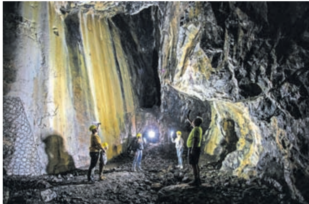
Obisk rudnika

začeli leta 2020. Velik izziv nam je predstavljalo predvsem neznano stanje notranjosti rudniškega kompleksa, ki je bil za zarušenimi vhodi Avgustovega, Jakobovega, Fridrikovega, Jurijevega ter Alojzijevega rova, medtem ko sta bila lažje dostopna Antonov in Julijev rov. Po intenzivnem zbiranju informacij in preučevanju stare dokumentacije smo konec leta 2022 naročili raziskovalna dela z laserskim skeniranjem, ki so se končala v maju 2023. Rezultat del nam je ponudil aktualen vpogled v rudniški sistem, s katerim bomo lahko lahkotno zasnovali nadaljnje korake. Tridimenzionalna skica, ki je bila plod požrtvovalnega dela, je bila temelj za stvaritev make-te Šentanskega rudnika, ki omogoča sleherniku lažje do-jemanje tega izjemnega rudniškega sistema. Letos smo naročili pripravljajna dela, s katerimi bomo v čim večji meri zagotovili optimalno prehodnost in dostopnost Šentanskega rudnika za nadaljnja dela in raziskovanja s končnim ciljem vzpostavitve Podzemnega doživljajskega parka Sveta