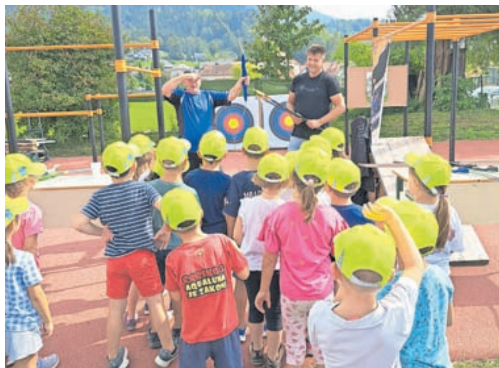
Veliki poudarek so dali športu mladih.