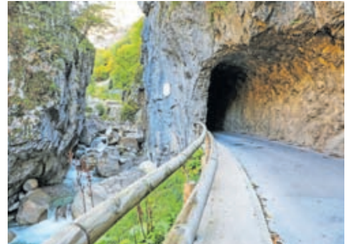
V skalo izklesan predor v Dovžanovi soteski spada med najbolj slikovite v Sloveniji. Prihodnje leto bo minilo 130 let od začetka njegove gradnje.

Poseben pečat v soteski pa puščajo tudi tektonske sile in erozijski dejavniki, ki so izklesali visoke skalne piramide ali turne in v strugo Tržiške Bistrice nasuli ogromne bloke kremenovega