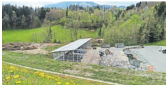
Nova nadstrešnica na spodnjem platoju za prekladanje odpadkov

oblaščne družbe, saj se zaradi zunanega vpliva spreminjata tudi sama teža in energijska vrednost odpadkov. Investicijo je financirala Občina Tržič. V prihodnje je predvidena izgradnja še ene nadstrešnice nad osrednjim delom prekladalnega platoja ter postavitve strehe nad celotnim zbirnim centrom odpadkov.