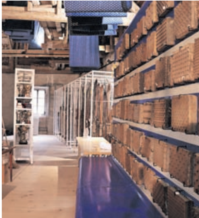
Urejanje podstrehe muzeja

Ogledni depo na podstrehi ne bo le skladišče, temveč želimo ustvariti ambient »babičine podstrehe«, omogočiti sprehod po labirintu med množico predmetov, ki bodo obiskovalce navduševali.