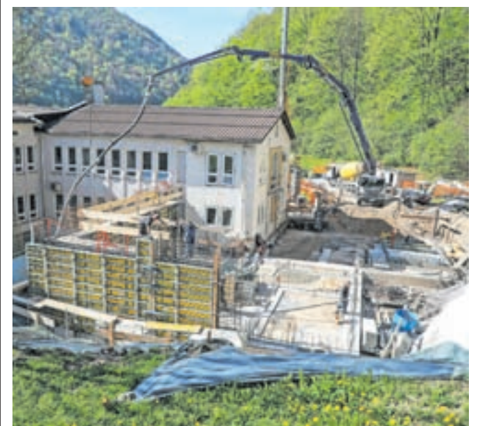
Če bo šlo vse po načrtih, bodo čez slabo leto dni prerezali slavnostni trak ob odprtju novega prizidka.