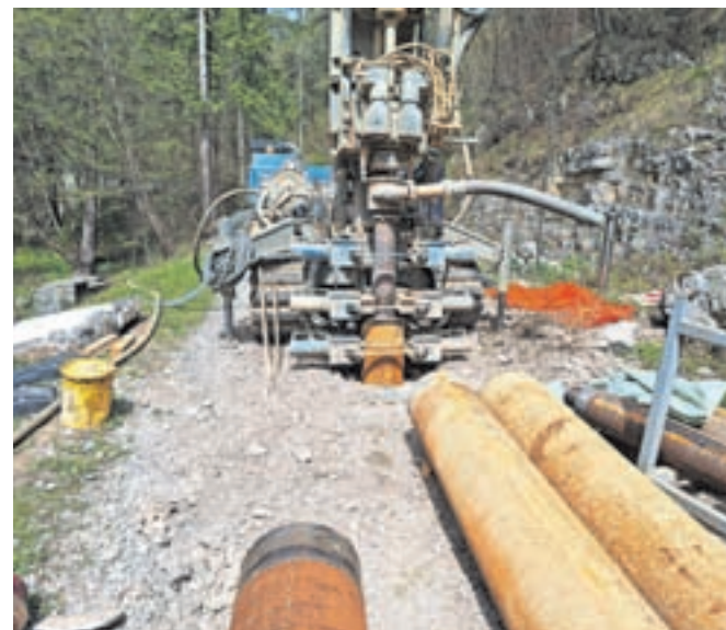
Nova vrtina Smolekar bo imela kapaciteto črpanja vode do 50 litrov na sekundo.

litrov na sekundo, medtem ko bo imela nova kapaciteto kar do 50 litrov na sekundo. Vrtina bo namenjena izboljšani oskrbi z vodo v Tržiču, njena kapaciteta pa bo zadostovala tudi za morebitno oskrbo sosednje občine Naklo, če bi se dogovori razvili v to smer.