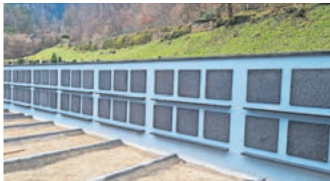
Žarni zid na pokopališču v Tržiču

Lom pod Storžičem, Tržič – Iz Občine Tržič so sporočili, da je gradnja poslovilne kapele na pokopališču v Lomu pod Storžičem v zaključni prvi fazi. Vežica je pozidana in pod streho, vrednost investicije je približno 105 tisoč evrov. »Naslednja faza bo po zagotovitvi sredstev na vrsti predvidoma drugo leto, ko se bodo vgradila okna, vrata