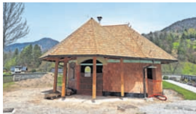
Gradnja poslovilne kapele v Lomu pod Storžičem