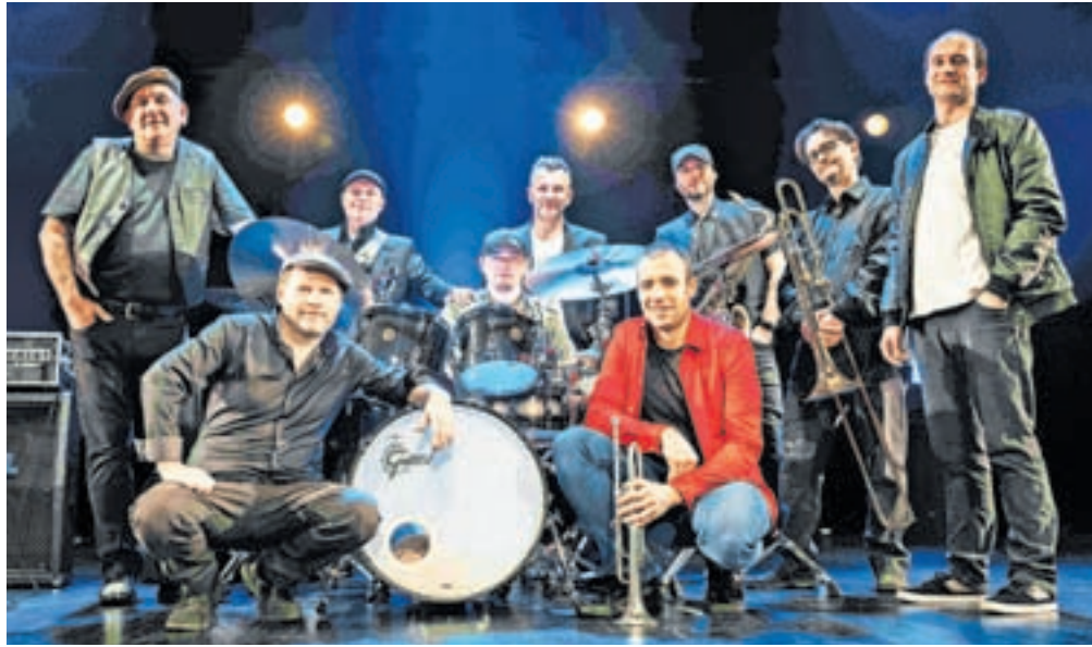
Orlek express iz Zasavja prihaja ob Tržiško Bistrico / FOTO: ARHIV SKUPINE ORLEK

Če na hitro preletim vašo koncertno dejavnost v zadnjega četrta stoletja, je minilo že kar nekaj časa od vašega zadnjega nastopa v Tržiču ... V Tržiču smo nazadnje nastopili poleti 2019, ko smo igrali na tržiški »plaži«. V goste so nas v sodelovanju z Občino Tržič povabili tržiški »pleharji«, s katerimi smo tudi skupaj zaigrali nekaj pesmi. Še iz časa, ko smo Orleki pogosto nastopali skupaj s Pihalnim orkestrom Svea Zagorje, nam je ostalo sedem aranžmajev in vsako leto nas eden ali dva pihalna orkestra povabita k sodelovanju.