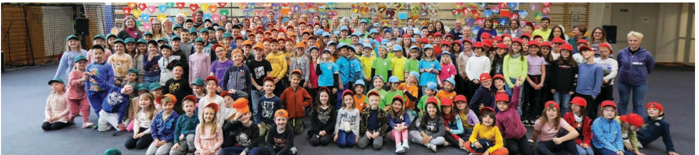
Na fotografiji: učenci sodelujočih šol, ki jih barvno simbolizirajo kape – učenci POŠ Podljubelj oranžne, učenci POŠ Lom pod Storžičem zelene, učenci iz Avstrije modre in učenci iz Italije rdeče.

Obuditev sodelovanja slovenskih šol doma in v zamejstvu ima veliko vrednost, saj ohranja in krepi prijateljske vezi, vsem udeležencem nudi bogate jezikovne izkušnje ter vpogled v življenje in spoznavanje naravnih in kulturnih značilnosti kraja in pokrajine, kjer deluje posamezna šola. Prihodnje leto bo srečanje potekalo v Italiji.