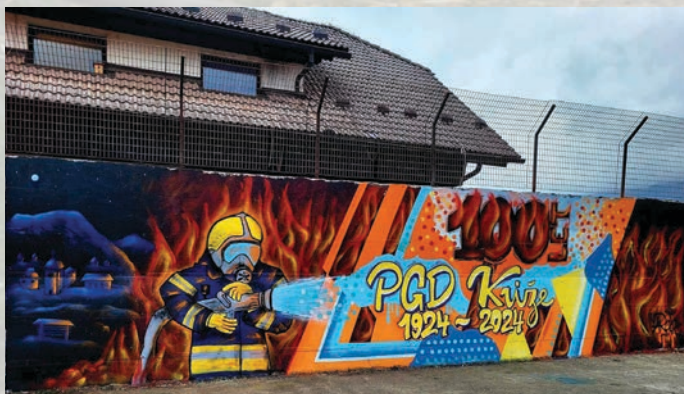
Grafit, ki ga je izdelal Aljaž Rogelj.