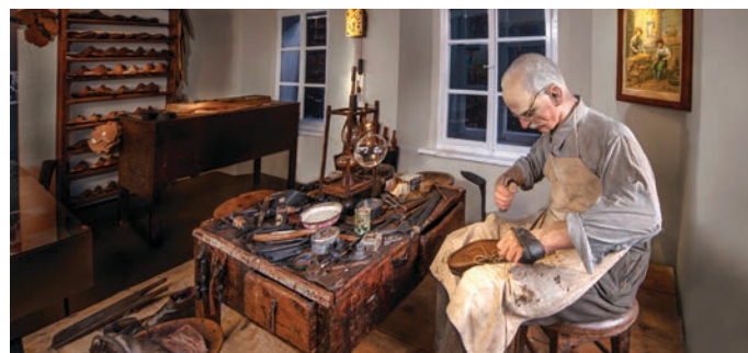
Predstavitve čevljarke delavnice na občasni razstavi tržiškega muzejskega društva leta 1954 v tedanjem tržiškem Hotelu Pošta in po 70 letih na stalni razstavi v Pollakovi kajži.