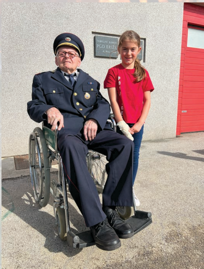
Najstarejši član in najmlajša članica PGD Križe.

Za 80. letnico društva je bila leta 2004 prirejena prva veselica. Veselice so se prirejale vsako leto meseca junija. Šest let kasneje smo