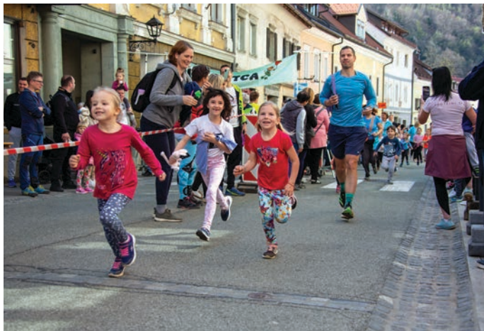
Najmlajši tekači Vrtca Tržič