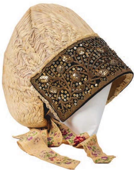
Avba Tončke Zaplotnik

V imenu Tržiškega muzeja hvala vsem za zbiranje in hranjenje prežitkov naše pomembne lokalne dediščine.