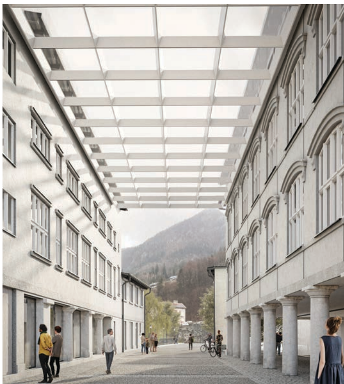
ZBRALA: MATEJA NOSAN