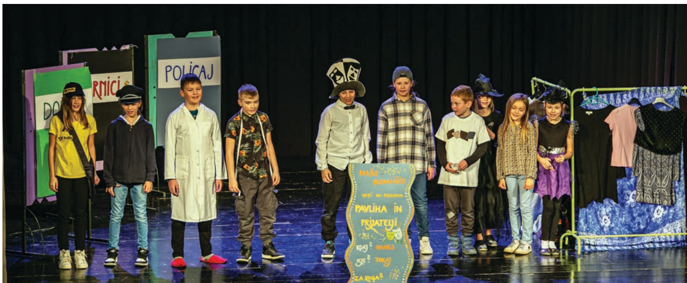
Devet prijateljev, OŠ Bistrica

Več o dogodkih na področju ljubiteljske kulture si lahko ogledate na Facebook strani Območne izpostave Tržič (OI JSKD Tržič).