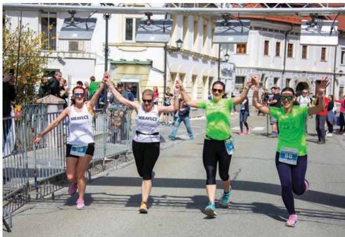
Sodelovale so tudi Mravlice

Hvala Občini Tržič in vsem ostalim sponzorjem, ki so nam pomagali, da so vsi udeleženci teka, od najmlajših do najstarejših, lahko prejeli bogate darilne vrečke.