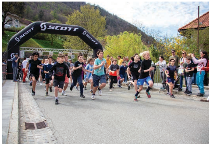
Tek osnovnih šol