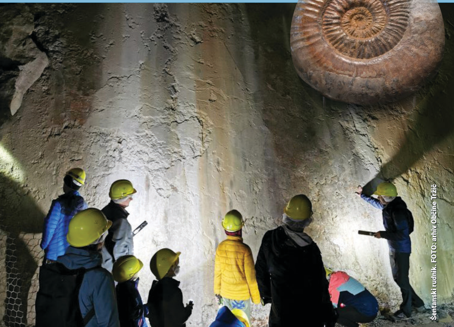
Šentanski rudnik.