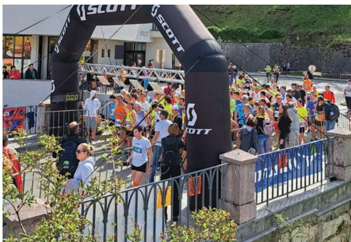
Start odraslih na 5 in 10 km