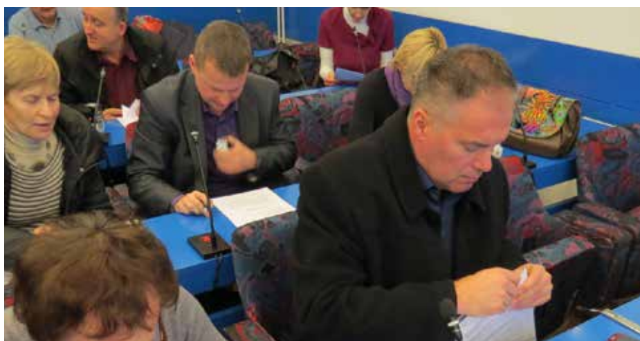
Predstavniki športnih društev med podpisovanjem pogodb

Sistem zaščite in reševanja poleg štaba Civilne zaščite tvorijo še enote gasilcev, gorskih reševalcev, kinologov, gradbeni-