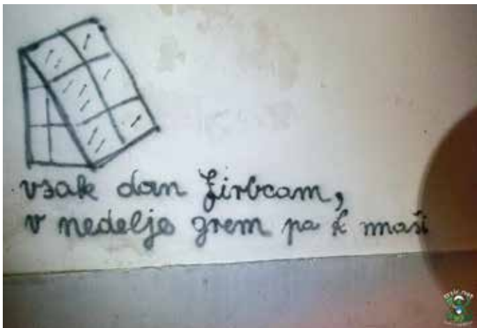
Nasproti cerkve svetega Andreja je nastal nov grafit. Ta je sicer hudomušen, vendar vseeno z grenkim priokusom kazi podobo našega mesta. Ne glede na to, da je napis podoben sloganu portala www.trzic.net , grafit ni njihovo delo.