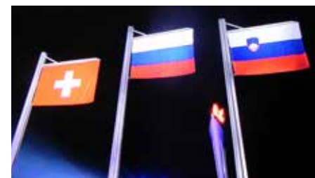
Dvig slovenske zastave v čast Žanu Koširju.

Srebrnemu in bronastemu olimpijcu Žanu Koširju smo ob prihodu z OI v Tržiču pripravili sprejem, kakršnega si ga nosilec olimpijske medalje tudi zasluži.