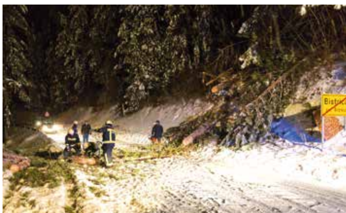
Snežne razmere v Tržiču.