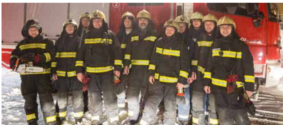
Gasilci PGD Bistrica pri Tržiču