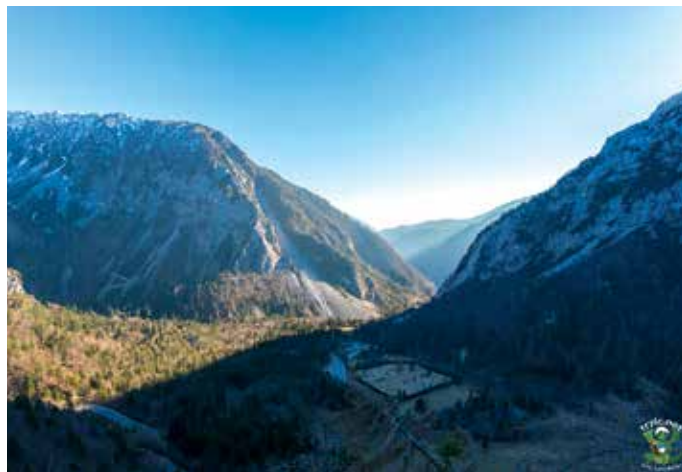
Lepo nedeljsko popoldne je treba izkoristiti. Prijetne, skoraj pomladne, temperature v preteklih tednih so tudi na plato na Ljubelju privabile veliko obiskovalcev in ljubiteljev gora. Nekateri so se odločili oditi na Zelenico, Prevalo, nekateri pa na stari Ljubelj. In med slednjimi so bili tudi ustvarjalci portala www.trzic.net .