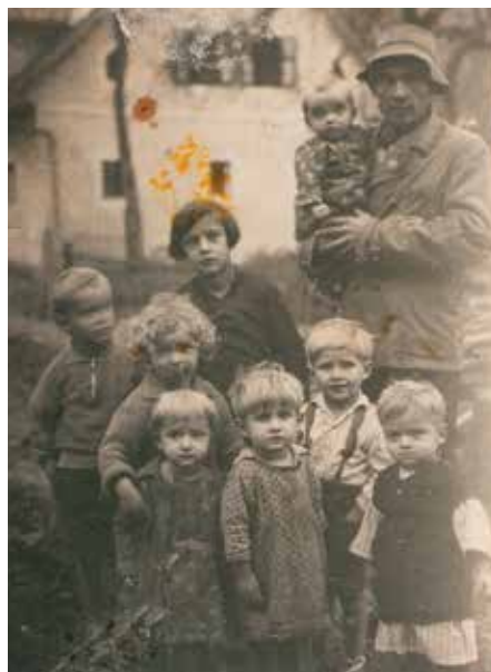
Fotografija iz srede tridesetih let 20. stoletja. Fotografirano pred Kodelnekovo hišo v Lešah.

približno dve leti. Nastala je pred slabimi osemdesetimi leti. Na fotografiji stoji