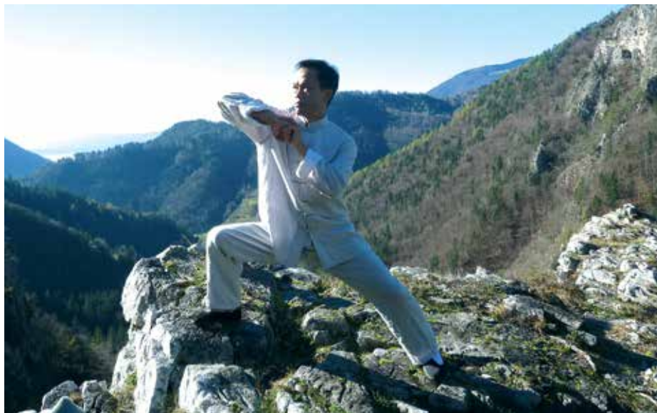
Kitajski mojster Fu Nengbin na 'piramidi' nad Dovžanovo sotesko.

Članek je v celotni objavljen na spletni strani http://www.trzic.si/clanki.aspx .