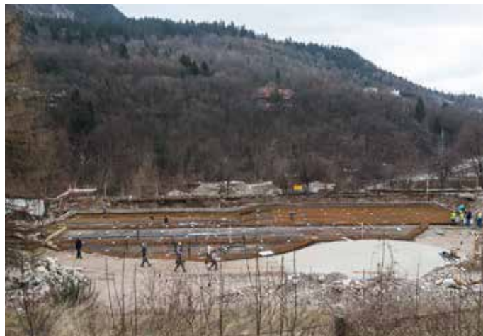
Gradnja Gorenjske plaže počasi, a vztrajno napreduje.