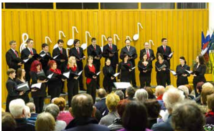
Tržič poje 2014.