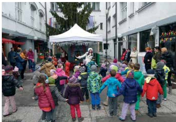
Konec decembra je Atrij Občine Tržič vabil nakupovalce in obiskovalce s pisanim sejamskim vrvežem in bogatim spremljevalnim programom. Dogodke je ob podpori Občine Tržič in drugih sponzorjev pripravila Polona Brodar s.p.