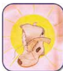
Logotip Gregorjade, ki so ga oblikovali mladi raziskovalci Osnovne šole Križe.

Letos smo mladi raziskovalci Osnovne šole Križe pripravili raziskovalno nalogo z naslovom Gregorjada. V njenem okviru smo raziskali, kako so praznovali Gregorjevo v preteklosti, ugotavljali smo, kako se je šega razvijala v Tržiču in širše na Slovenskem, sklenili pa smo z razmišljanji, kako šego, povezano s prebujanjem narave in čevljarsko tradicijo, približati mladim. Naš temeljni cilj je bil usmerjen v iskanje načinov, kako praznik približati današnjim najstnikom,