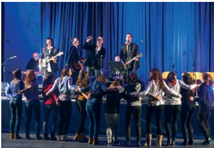
Dobrodelni koncert Rokometnega kluba Naklo – Peko Tržič, na katerem so zbirali sredstva za domače rokometiške, ki se uspešno borijo v najmočnejši državni 1. A rokometni ligi za ženske.