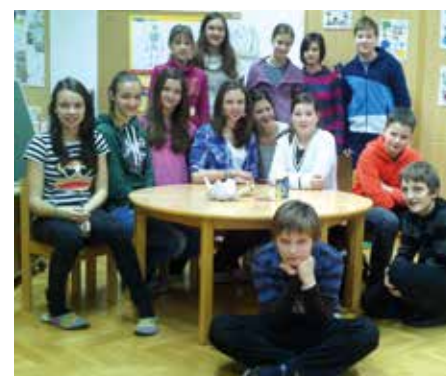
Učenci Osnovne šole Križe, ki so pripravljali projekt Gregorjada.

vodo, ki jo organizira Turistično društvo Tržič v torek, 11. marca 2014, popoldne v Tržiču.