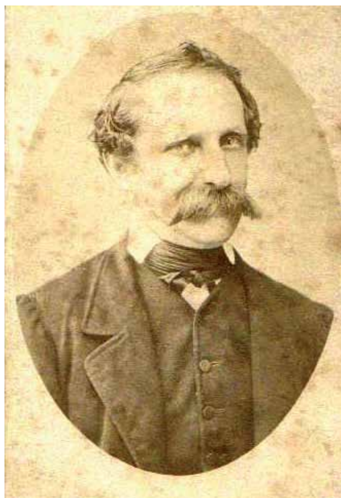
Ena manj znanih portretnih fotografij Vojteha Kurnika

Hišo si lahko ogledate po predhodni najavi (tel.: 04/53-15-500; e-naslov: sonja.slabe@guest.arnes.si), še prav posebej pa vabljeni na brezplačni ogled ob kulturnem prazniku in tržiškem tržnem dnevu, 8. februarja 2014, med 9. in 13. uro.