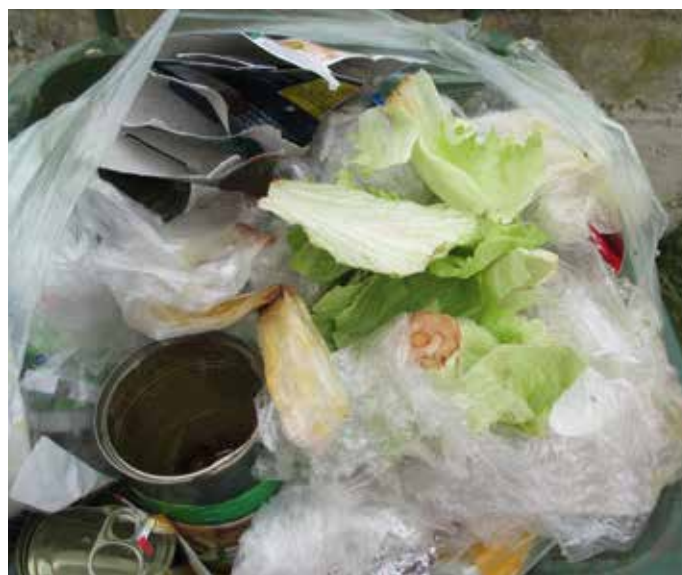
✗ biološko razgradljivi odpadki