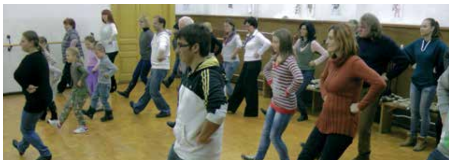
Utrinek s predstavitev

Za projekt smo se odločili predvsem zato, ker nam ni vseeno, kako se bo razvijala slovenska, predvsem pa tržiška kultura, ker nam ni vseeno, kakšen bo razvoj Folklorne skupine Karavanke in drugih folklornih skupin v prihodnje in ker nam ni vseeno, na kakšen način ljudem predstavljamo slovensko ljudsko izročilo. Vedno smo strmeli h kakovosti in k temu želimo strmeti tudi v prihodnje.