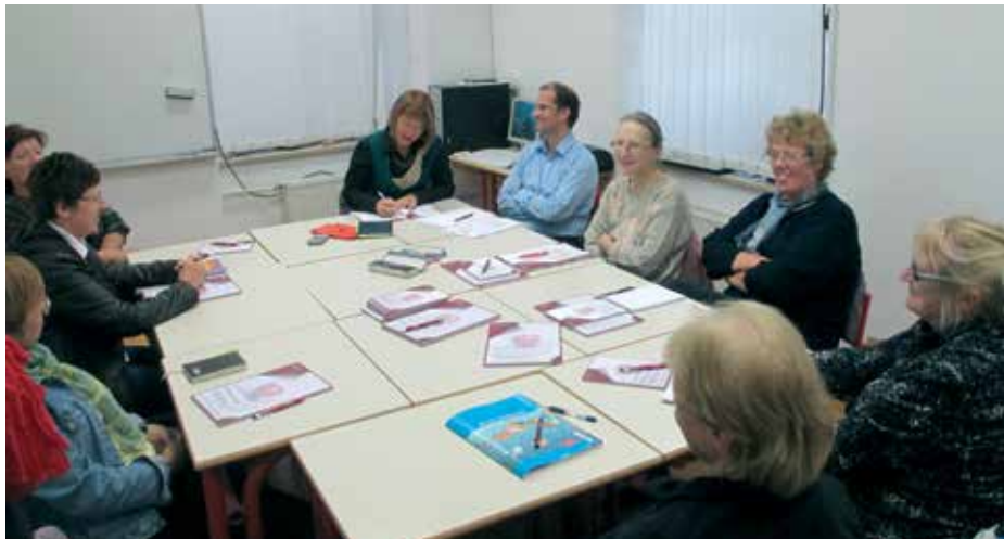
S srečanja ljubiteljev tržiške dediščine na Ljudski univerzi v Tržiču