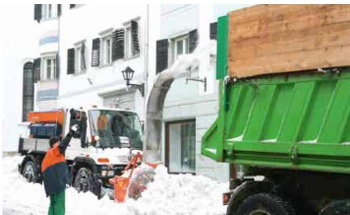
Kako je Tržič ostal brez snega.