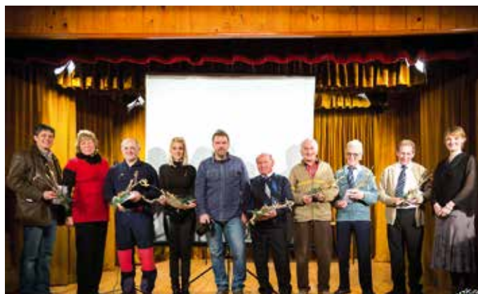
Vitalne legende KUD-a Podljubelj.