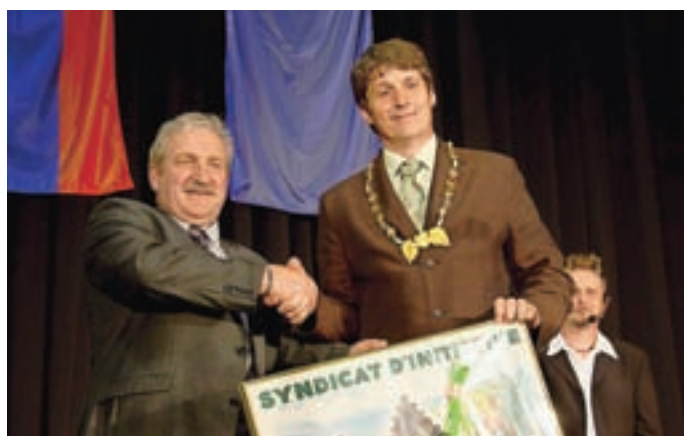
Župana obeh mest sta s podpisom listin sklenila ohranjati prijateljstvo.