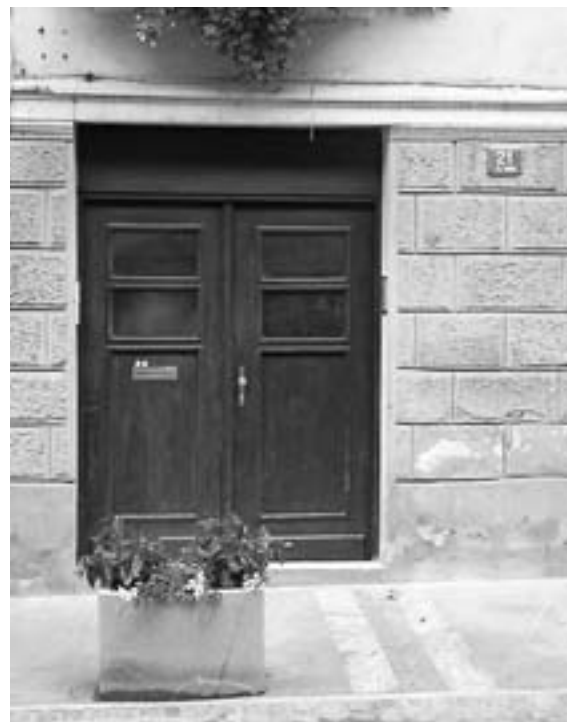
Vhod v nekdanje domovanje Primicevih v Tržiču

Tudi jedli so in to ob določenem času. Ob 7. uri je gospodar razrezal dva hlebca kruha. Pojedli so ga pri kavi za zajtrk. Pri težkem delu so delavci dobili za malico kruh z maslom ali sirom. Gospodar je nato obšel vse obrate in prostore ter dajal navodila. Sam je delal v izdelovalnici ali v skladišču pri odpremi usnja. Za kosilo je bila juha in goveje meso s prikuhami. Ob 15. uri je gospodar ponovno razrezal kruh za malico pomočnikom. Ob 19. uri se je končal enajsturni delovni dan. Pri večerji se je zbrala vsa družina s pomočniki. Dekle, vajenci, hlapci in dni-narji so jedli v kuhinji. Jedli so juho in pečenko, pečeno na žaru s prikuho. Ko so čez čas vzdali štedilnik, se prave pečenke na žaru ni dalo speči. Gospodar je opravil še poslovno pisarijo, nato pa zaprl hišna vrata. Na slabo razsvetljenih tržiških cestah je zavladala tišina.