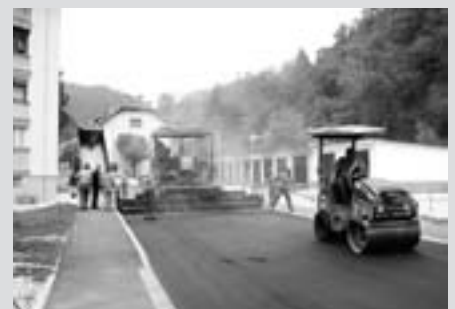
Asfaltiranje na Ravnah

V poletnih mesecih so v Tržiču potekale gradnje na številnih odsekih. Po propadu SCT-ja, vodilnega partnerja v okviru kohezijskega projekta, nam je uspelo skleniti gradbeno pogodbo z novim vodilnim partnerjem, Gorenjsko gradbeno družbo, d. d.. Tako so stekla nadaljevalna dela na prenovi komunalnega omrežja ter cestne infrastrukture Za Virjem. Za potrebe obvoza smo preplastili tudi Cankarjevo cesto na odseku proti Virju, saj je bila v tako obupnem stanju, da prihodnje pomladi, ko bodo stekla dela na celoviti prenovi naselja Virje, verjetno ne bi zdržala. V sklepno fazo se prevešajo tudi dela na Ravnah, kjer je cesta asfaltirana praktično že skoraj skozi celotno naselje. S septembrom je stekla druga faza projekta "Prenova ulic starega mestnega jedra", ki je sofinanciran s strani Evropskega sklada za regionalni razvoj. V preteklih letih smo prenovili dobršen del ulic v mestnem jedru, trenutno dela že tečejo na Blejski cesti, spomladi pa s celovito prenovi komunalne in cestne infrastrukture začnemo še Za Virjem. Že letos pa bomo prenovili stopnišče iz Cankarjeve ceste proti Virju, ki je v zares slabem stanju. Z investicijami Tržiču vračamo nekdanjo podobo, s tem tudi izpolnjujem dano obljubo na začetku mojega županskega mandata, in sicer da bomo staro mestno jedro popolnoma prenovili in s tem prebivalcem omogočili kvalitetne pogoje za normalno življenje in razvoj.