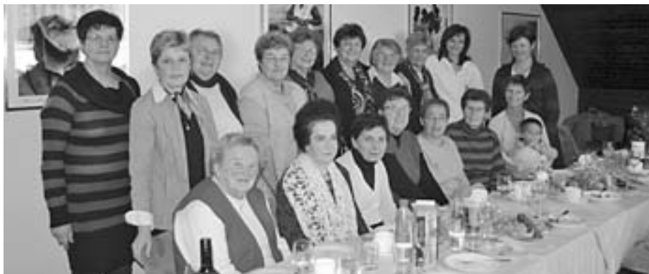
Prostovoljke v Domu Petra Uzarja