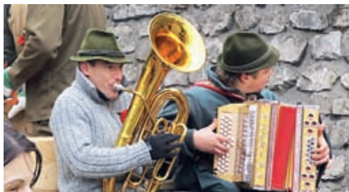
"Muska" pa je skrbela za veselo razpoloženje.