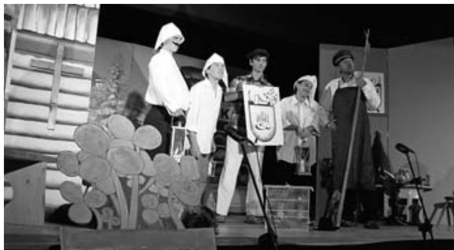
Prepričljivi Butalci Frana Milčinskega v izvedbi KD Kruh Križe