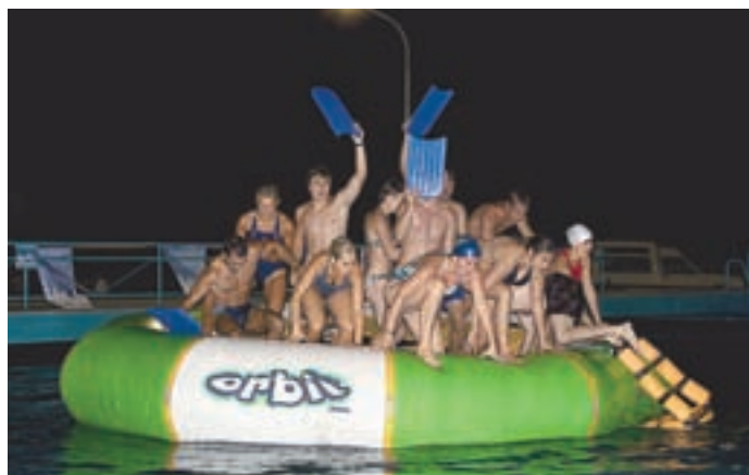
Ekipe pobratenih mest so se pomerile na Igrah veselja in smeha.