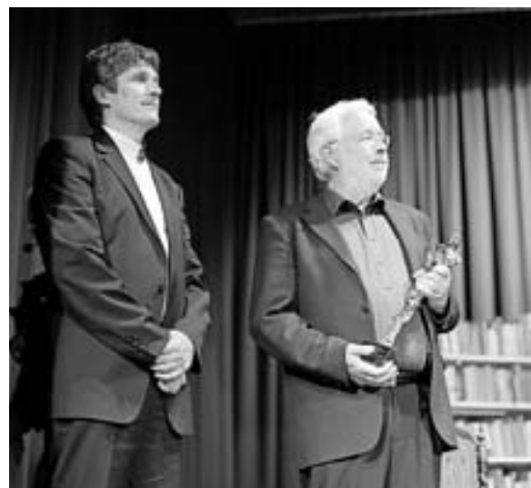
Tržiški župan s Pretnarjevim nagradjemcem