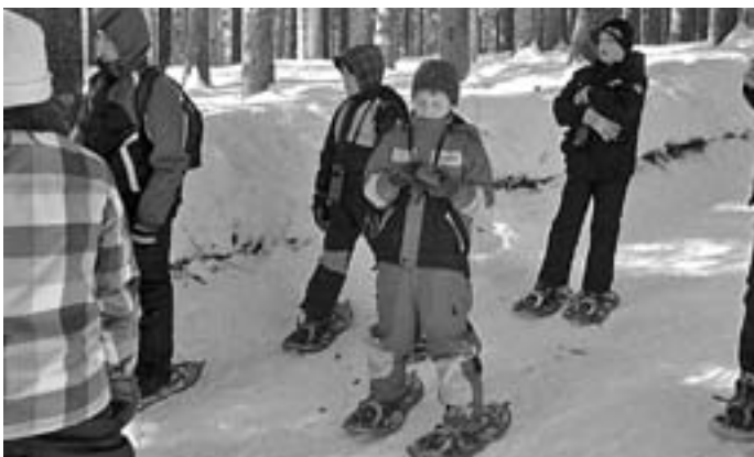
Pohod s krpljami in iskanje lavinske žolne