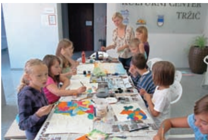
Ustvarjanje na delavnici Poletje v naravi

veseljem ugotavljamo, da se vsako leto več otrok ob sobotah v juniju in avgustu v družbi staršev ali starih staršev zapodi po stopnicah Kulturnega centra Tržič, ker ve, da jih čaka brezplačna predstava ali delavnica, v avli pa barvit "škatljak", po nekakšnem čudežu vedno poln bombonov. Iskrena hvala vsem za obisk in morda nekaj besed zadovoljstva ob izhodu ali na Facebooku. Zaradi sijočih obrazov obljuba velja, da naslednje leto spet povabimo pisano družčino junakov, ki se jim bomo lahko nasmejali in se z njimi fotografirali. Pa čeprav bo deževalo, čeprav imamo počitnice in radi dolgo spimo, čeprav ... Se vidimo, morda v še večjem številu!