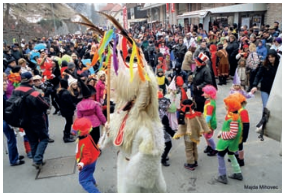
Veselo rajanje pred razglasitvijo najboljših mask.