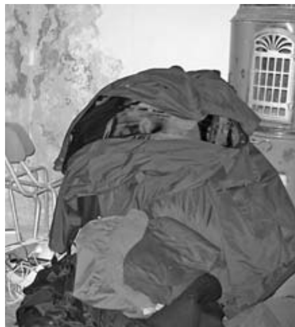
Veliko dela z odstranjevanjem navlake

Z županom smo se dogovorili, da KS Ravne dobi v uporabo dvorano oz. prostore v pritličju "Mladinskega doma", Pot na Zali rovt 3. Tu se bo uredila dvorana za družbene, kulturne in športne aktivnosti (namizni tenis, pikado, biljard, streljanje ipd.). Seveda je dvorano potrebno urediti, saj jo je prejšnji uporabnik zapustil v katastrofalnem stanju. Trenutno odstranjujemo raznorazno navlako, stare cunje, omarice, police ... potem pa pride na vrsto ple-