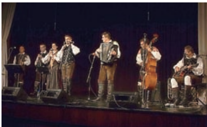
Z ansambлом Veseli Begunjčani Avsenikova glasba zazveni v vsej veličini.