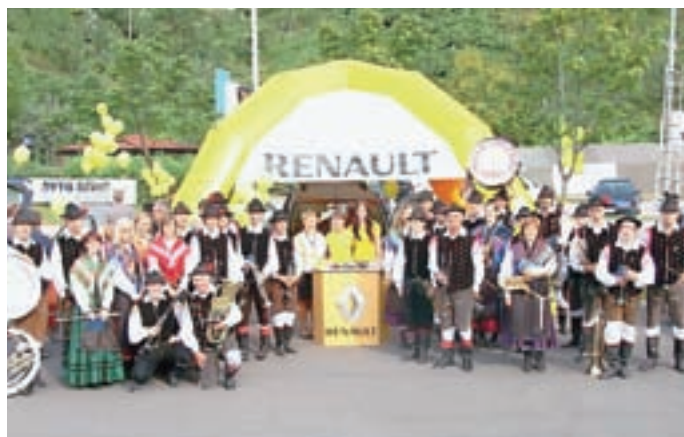
Nedeljsko jutro je na prizorišču pred Pekom prebudil Pihalni orkester Trzič.