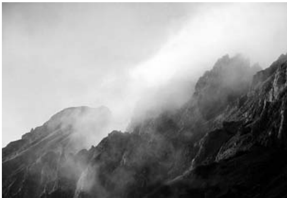
Meglice nad Košuto