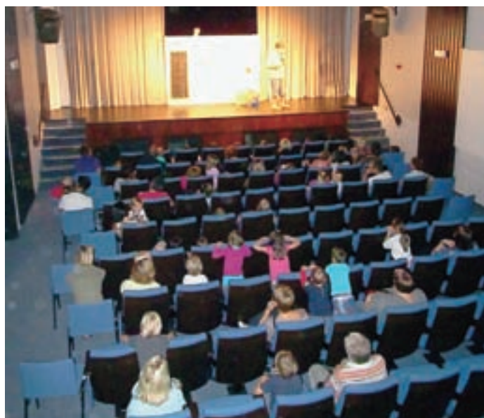
Veseli smo vedno bolj polne dvorane.