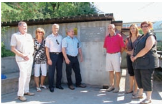
V parku prijateljstva zaznamuje pobratenje nova spominska plošča.