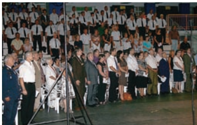
Dvorana tržiških olimpijcev je gostila množico posebnih gostov.