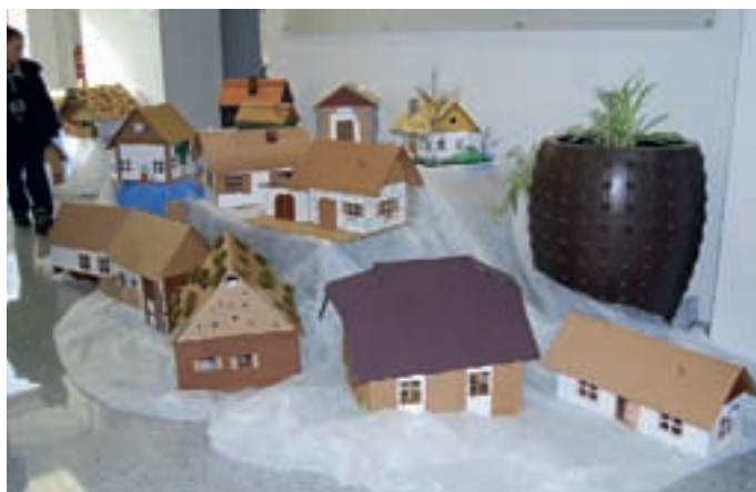
Alpske hiše, ki so jih izdelali učenci Ljudske šole Borovlje.