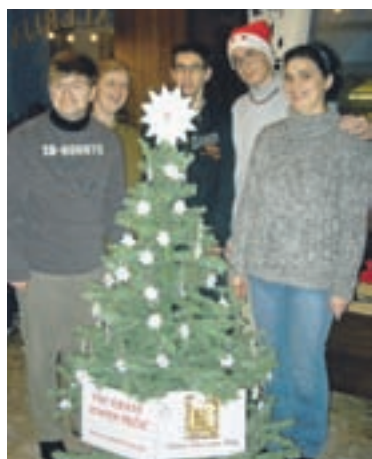
Ekipe tržiške enote VDC Kranj