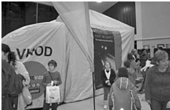
Vsak, ki se udeleži demonstracije v šotoru, prejme odsevni trak.

V OŠ Križe smo 2. decembra 2010 v času govorilnih ur in Novoletnega bazarja organizirali predstavitev Vidkovega šotora. Vidkov šotor je demonstracijski rekvizit, ki so ga pripravili na Direkciji Republike Slovenije za ceste. Z njim smo v našem okolju želeli poudariti pomen uporabe odsevnih predmetov in upoštevanje temeljnih pravil za večjo varnost pešcev. Učenci, starši in učitelji so spoznavali, kako vidni so na cesti, če so opremljeni z odsevnimi telesi: kresničko, odsevnim trakom. Tako so vsi udeleženci, ki so obiskali Vidkov šotor, preverili uporabo in vidnost odsevnega telesa v temi.