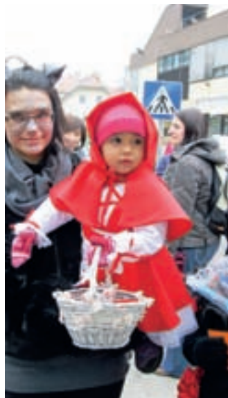
Nagrajena Rdeča kapica