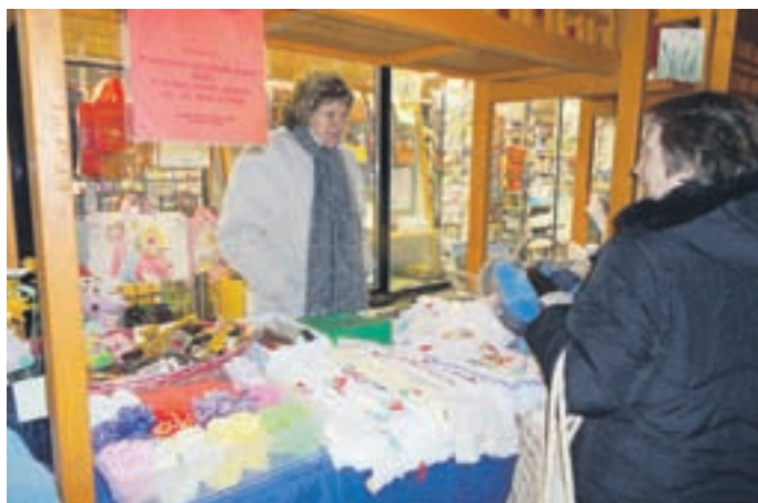
Na sejmu so se predstavile članice Ročnodelske skupine Nežke KUD Brezje pri Tržiču.