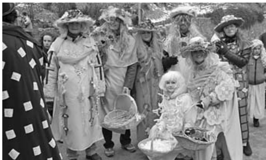
Letni časi s koledarjem na čelu, najboljša skupinska maska.