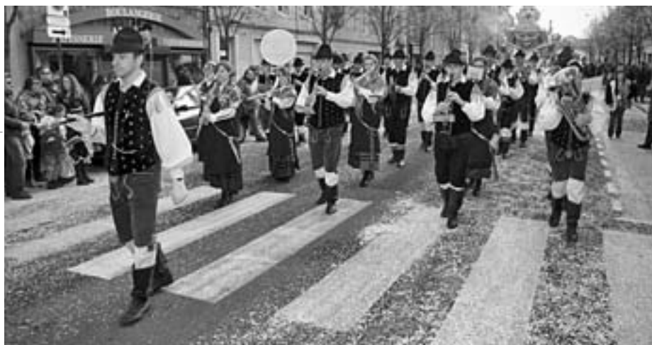
Pihalni orkester Tržič in mažoretni klub Takt na pustnem karnevalu

Topla pomladna sapica, beli oblaki se počasi trgajo, modro nebo pa obeta prijetno popoldne, popolno za karneval. Množica se počasi nabira, glavni trg je že nabito poln, na tisoče ljudi pa je zbranih tudi ob glavni cesti, po kateri se počasi premika nepregledna mešanica pisanih barv. Tu najdemo vse, od vročih plesalk iz daljne Brazilije do orkestrov Francije. od najrazličnejših pustnih šem, ki kličejo pomladi spev, do Baskovskih trub. In prav na sredini te veličastne kolone, se zasliši znan, domač napev ... Mi smo pa Tržičani ... Pogled gledalcev že išče v smeri glasbe, ki prešerno odmeva "Glej jih, gorenjske narodne noše. Tržičani so to, Tržiški pihalni orkester."