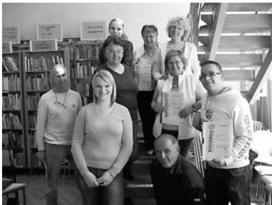
Zadovoljni udeleženci projekta Simbioz@

teri popolni začetniki, nekateri pa z nekaj predznanja, je ob pomoči prostovoljcev spoznavalo osnove strojne in programske opreme računalnika, programa za oblikovanje besedila Word, brskanja po internetu in uporabo elektronske pošte. Ob koncu tečaja so vsi udeleženci prejeli diplome in izpolnili evalvacijske vprašalnike, ki bodo v veliko pomoč pri pripravi in izvedbi glavnega dela projekta. Vrhunec bo potekal v tednu med 17. in 21. oktobrom 2011, ko bodo na različnih lokacijah po vsej Sloveniji mladi brezplačno učili starejše uporabe računalnika, ponovno tudi v naši knjižnici.