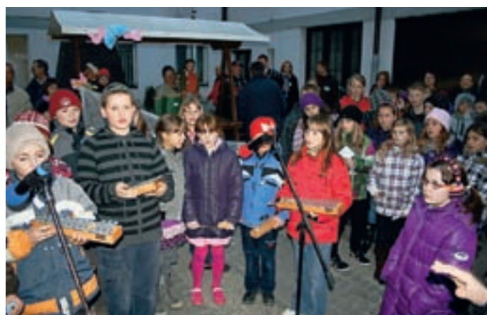
Kulturni program so sooblikovali kriški in boroveljski osnovnošolci.