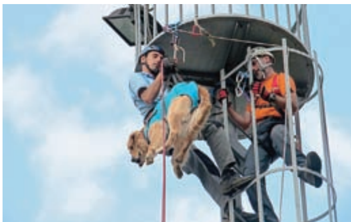
Z občudovanjem smo spremljali prikaze Kinološkega društva Storžič.