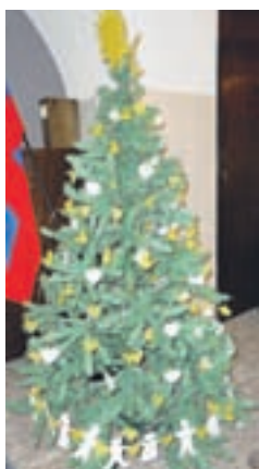
Najlepša jelka leta 2010 ekipe Kovorčki, POŠ Kovor