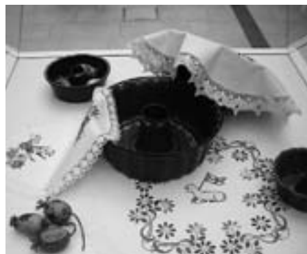
Razstava Ročnodelske skupine Nežke v Qlandii v Kranju

Pripravile smo tudi delavnico vezenja za mlajše, vendar kot pri nas na vasi tudi v mestu ni preveč zanimanja za to prelepo, pa vendar vse manj cenjeno delo. Ob tej priložnosti smo predstavile tudi naš kraj Brezje pri Trziču in druge dejavnosti, ki potekajo v okviru društva.