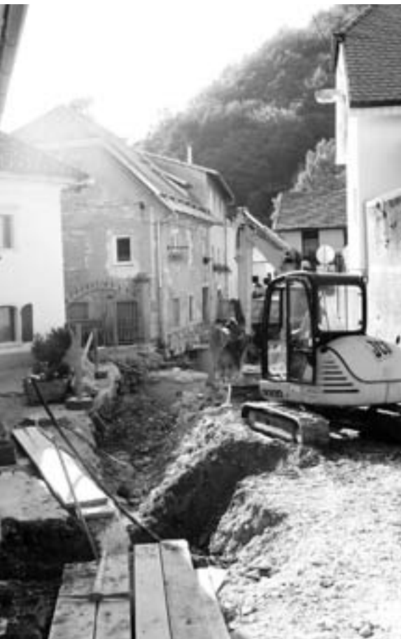
Dela na Blejski cesti

Operacija se izvaja v okviru Operativnega programa krepitev regionalnih razvojnih potencialov za obdobje 2007-2013, razvojne prioritete "Razvoj regij", prednostne usmeritve Regionalni razvojni programi. Razmerje med sredstvi na postavkah je v višini namenskih sredstev EU za regionalni razvoj 85 %, Občina Tržič pa financira 15 % delež.