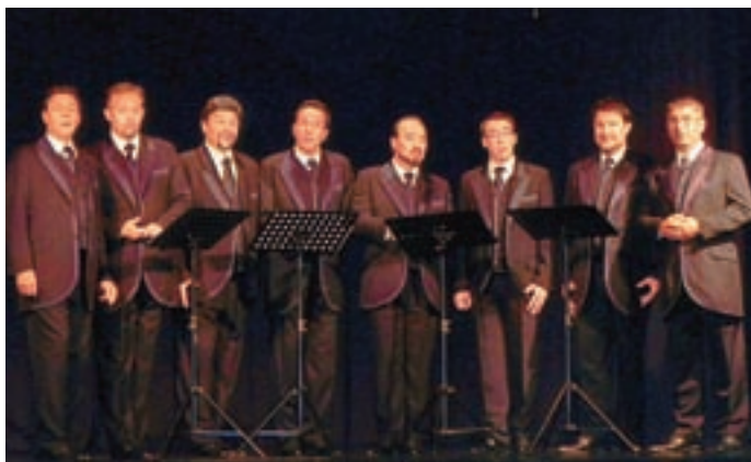
Slovenski oktet je v Tržiču gostoval tik pred 60-letnico svojega delovanja.