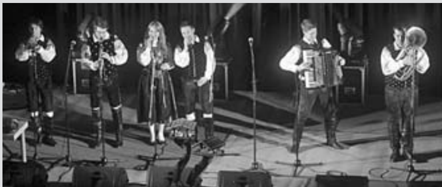
Ansambel Saša Avsenika je bil že drugič v Trziču.