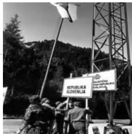
Ljubelj, 1. julija 1991

Zgodila se je vojna, ki je nismo hoteli, toda bili smo pripravljeni tudi na ta izziv in tudi z orožjem in oboroženim odporom je bilo potrebno potrditi in dokazovati našo odločenost, da gremo po nam lastni poti v prihodnost. Zavedanje doseženega je eden od temeljev krepitve nacionalne zavesti in naša moralna dolžnost je, da vedenje o naši poti v samostojnost ohranjamo in prenašamo tudi na mlade rodove. Žal niti šolski učni načrti vsebinsko ne zajemajo časa osamosvajanja in v tem času storjenih osamosvojitvenih prizadevanj. Prepričan sem, da so eden od pomembnih temeljev državotvornosti tudi zgodovinsko poznavanje prehojeni poti, v okolju, v