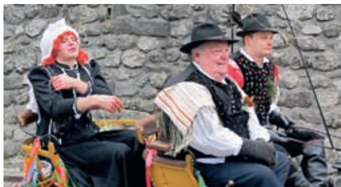
Nevesta je tožila: "Jest sem tuko žavostna!"