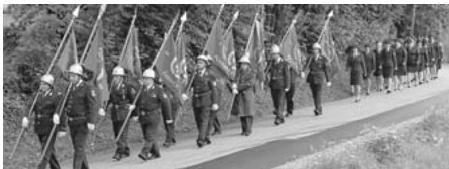
Ešalon praporščakov, sledi ešalon članic