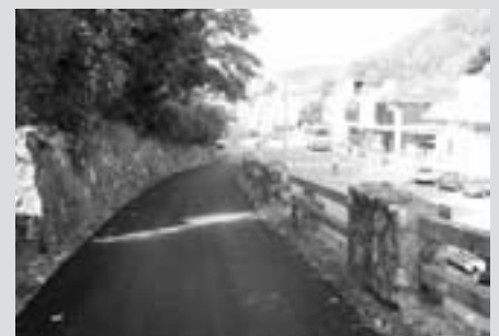
Preplastitev ceste Za Virjem