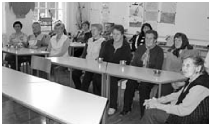
Na predavanju v Lomu

Ravno na dan ledvic, 12. marca, pa smo se podali v Lom. Vsako leto tam za krajanje pripravimo merjenja, nato pa še zdravstveno predavanje. Merjenj s je udeležilo kar 18 krajanov, zanimivo pre-