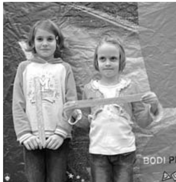
Vidko v Podljubelju