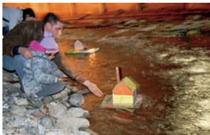
Končno je prišel čas, da vržemo "vuč u vodo".