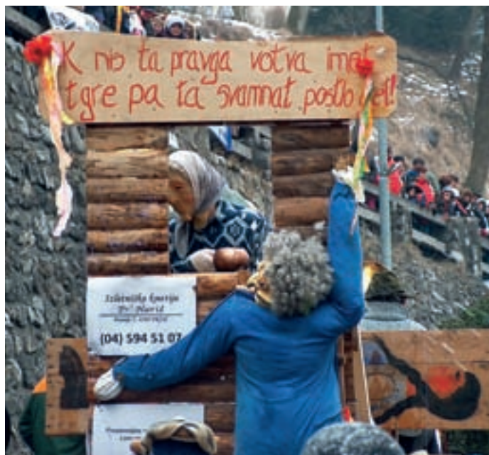
K nis ta pravga votva imet, t gre pa ta svamnati postlo gret.