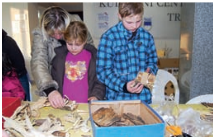
Delavnica "Izdelajmo si gregorčka" v Kulturnem centru Tržič.