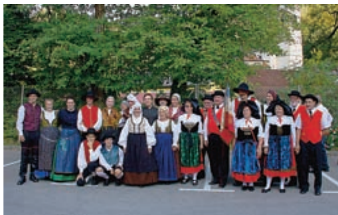
V obeh mestih folklorni skupini ohranjata ljudsko izročilo.