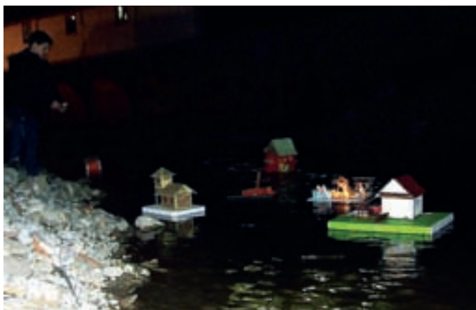
Gregorčki so odpluli v temno noč, dan bo odslej vse daljši.