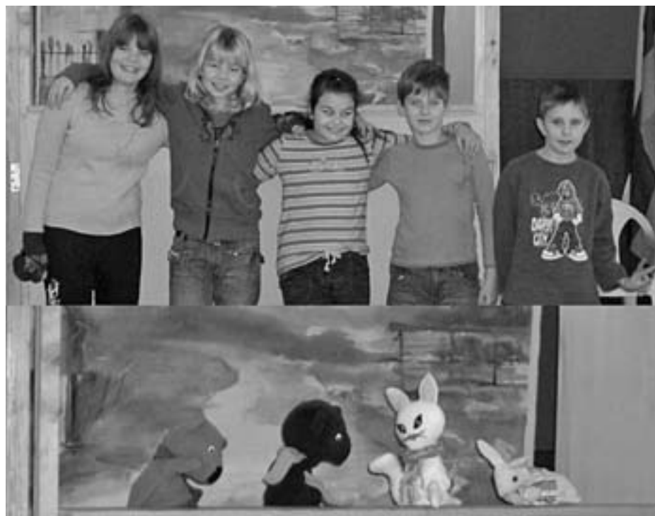
Lutkarji otroške dramske skupine KUD Brezje pri Tržiču / Foto: Joži Peteh