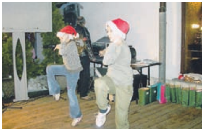
Poskočni rock 'n' roll plesalcev PK Tržič