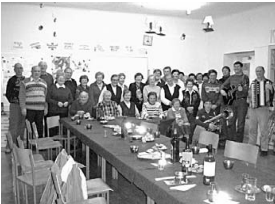
Starejši krajanji in krajanke Loma pod Storžičem