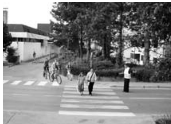
Na križišču v Bistrici

V tej prometni akciji je sodelovalo kar pet članov ZŠAM. Dežurni so bili pred vsemi tremi centralnimi šolami, poleg tega pa še v Kovorju. Naj pa pohvalimo tudi vse motorizirane udeležence na cestah, ki so navodila zelo dosledno upo-