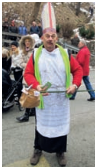
Kardinal je kar sam pobiral vbogajme.