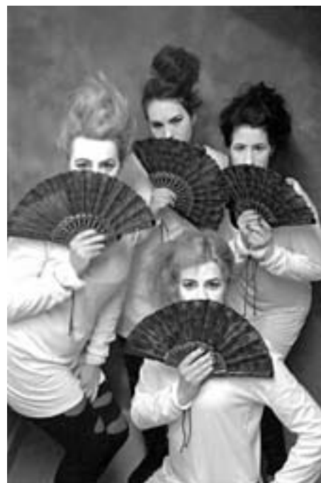
Plesna skupina IN se je predstavila s plesno miniaturo z naslovom Lutke.