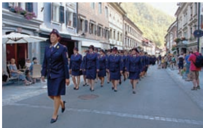
Gasilska parada skozi mestno jedro je bila paša za oči.