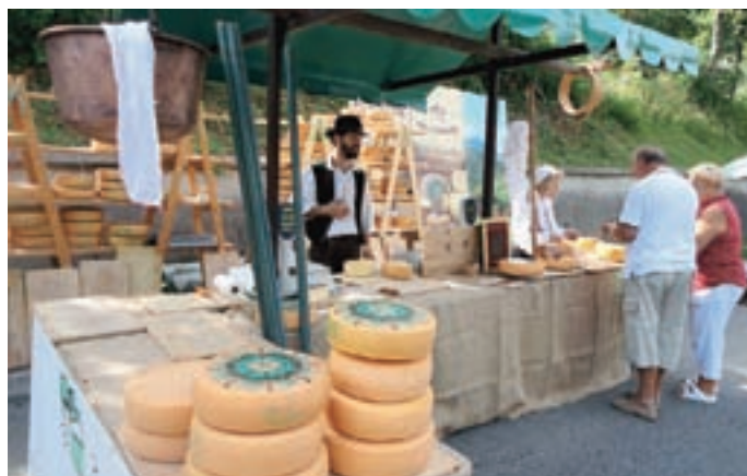
Naj rokodelska stojnica kmetije Pustotnik