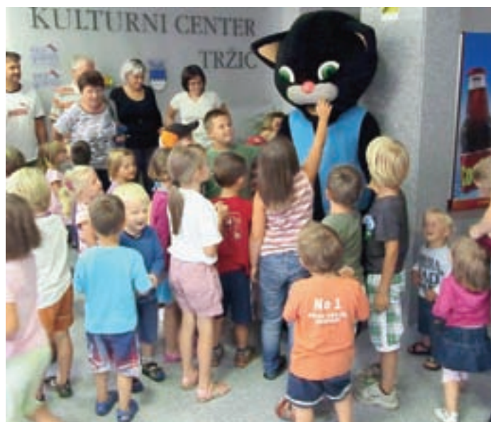
Po predstavi smo se srečali z mačkom Murijem.