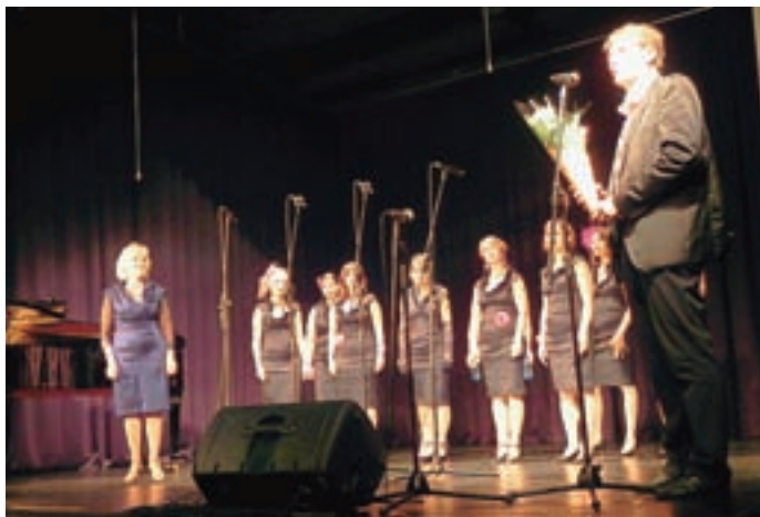
Vokalna skupina Plamen iz Toronta je navdušila tržiško publiko.