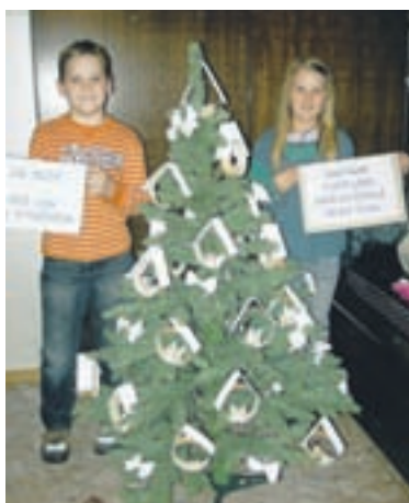
Jelka POŠ Lom