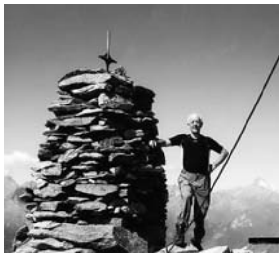
Sadnig (2745 m), 9. septembra 2010

Akcija teče od 14. septembra 2008 in jo bomo zaključili 14. septembra 2018, ko bo Planinsko društvo Tržič praznovalo častitljiv jubilej, 100-letnico delovanja. Torej je še dovolj časa, da sprejmete izziv! Vabljeni!