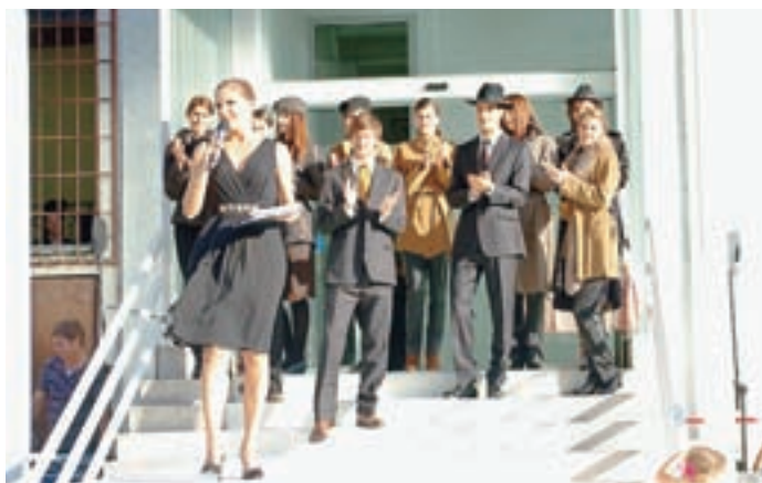
Peko je svojo novo trgovino odprl z atraktivnim dogodkom.