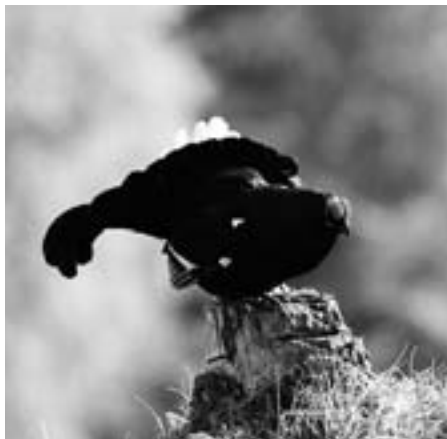
Rušavec (Tetrao tetrix)