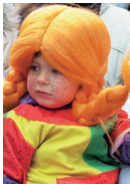
Prisrčna Pika Nogavička