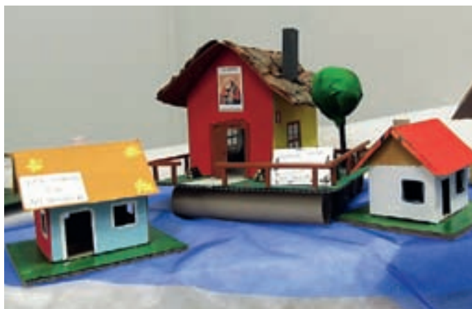
Hiše izpod spretnih prstov učencev OŠ Bistrica.