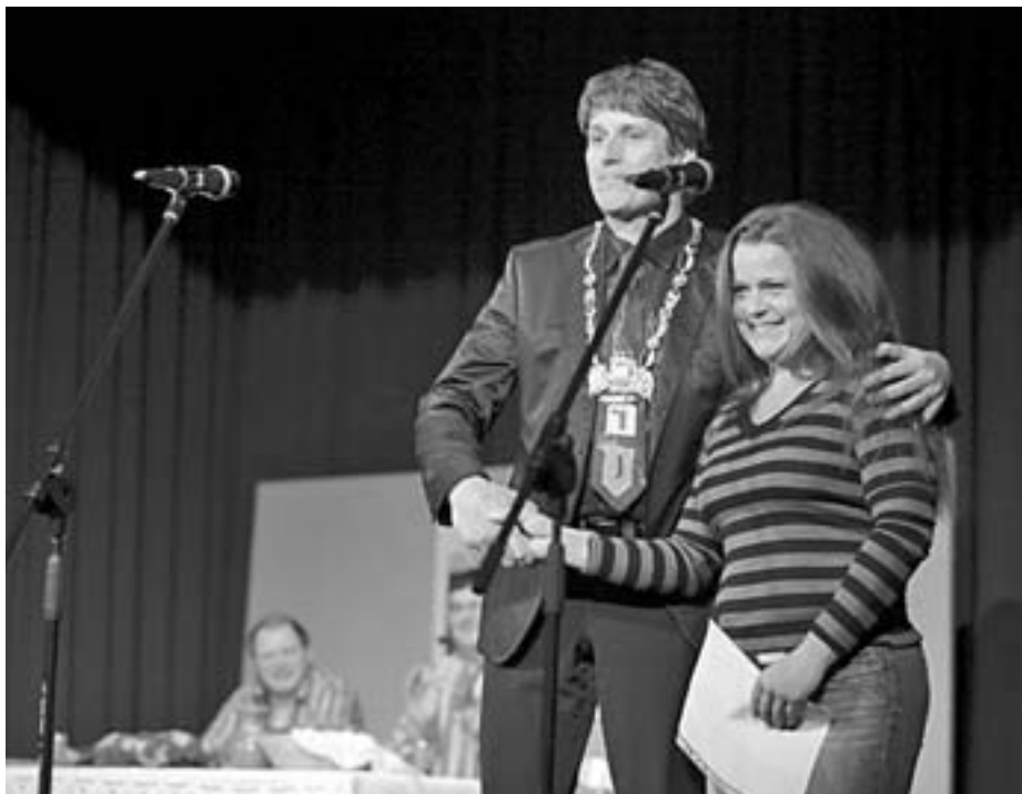
Nad nastopom je bil navdušen tudi župan.