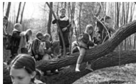
Vsi na drevo ...