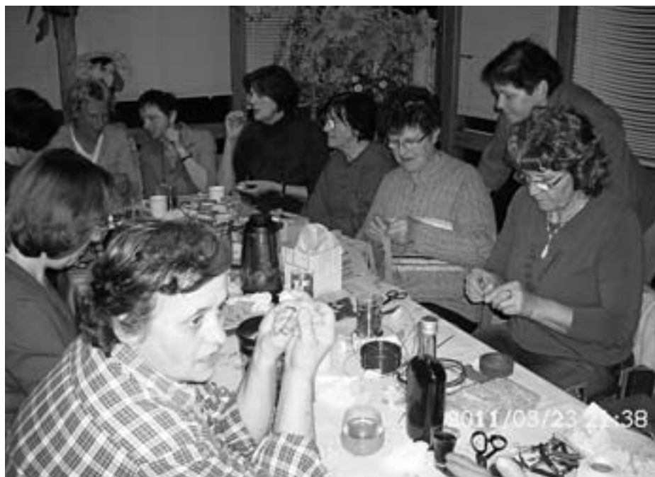
Na obisku pri članicah Društva podeželskih žena Svit iz Podljubelja