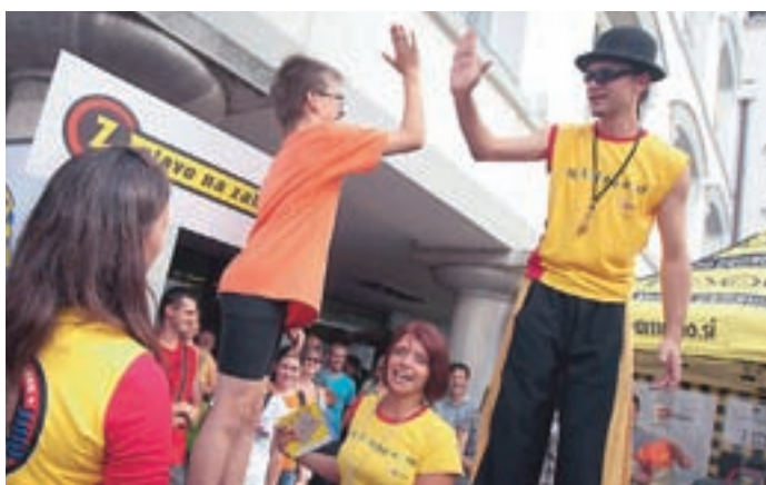
V atriju Občine Trzič je odmevalo "Z glavo na zabavo".