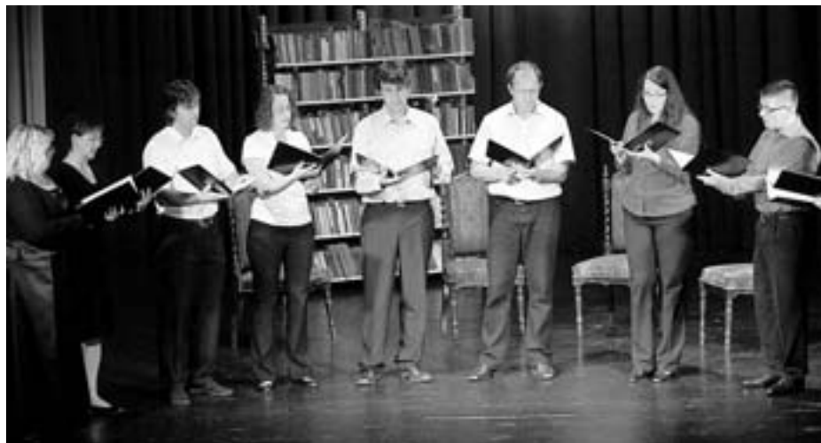
Vokalna skupina Carniolica