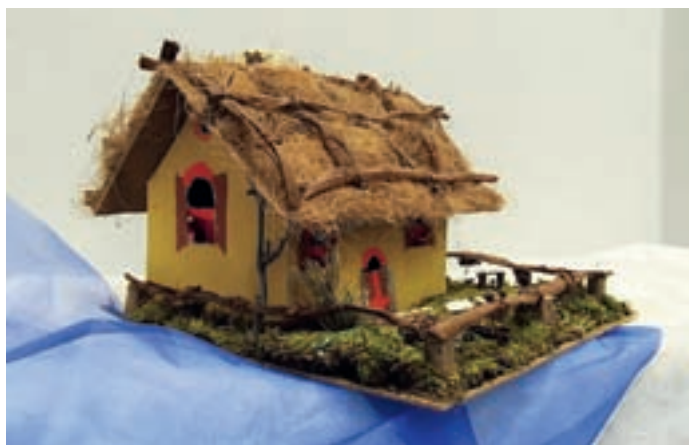
Gregorčki na razstavi so bili izdelani iz različnih materialov.