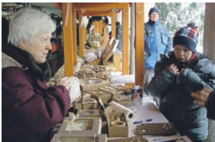
Sejem bil je živ!