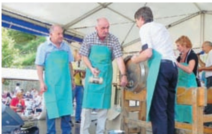
Tradicionalno so organizatorji z gosti odprli in razdelili tudi sod piva.