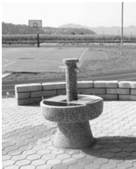
Nov pitnik na vhodu v park

Sredi septembra sledi uradno odprtje atletskega parka s številnimi športnimi in družabnimi prireditvami.