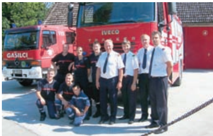
Pobratenje sloni tudi na gasilcih obeh mest.