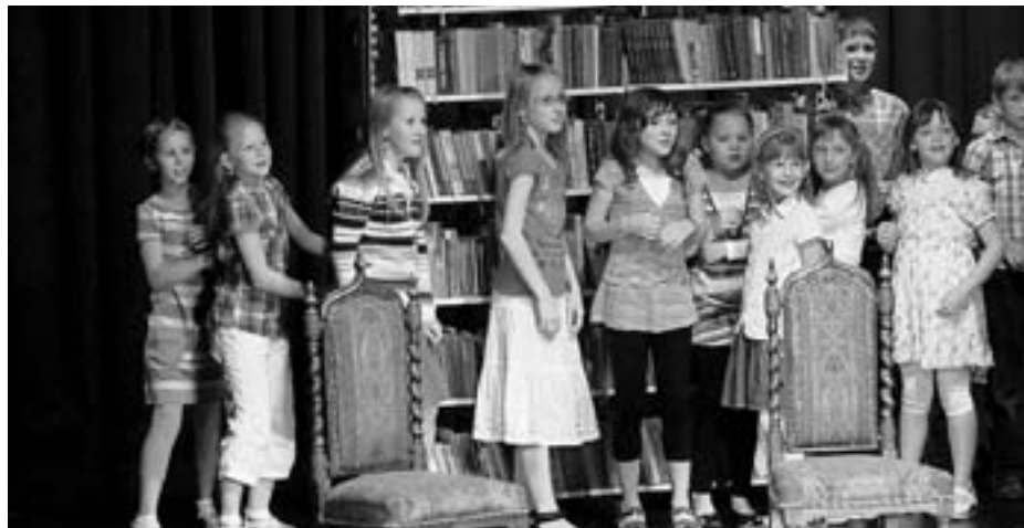
Otroški pevski zbor POŠ Lom