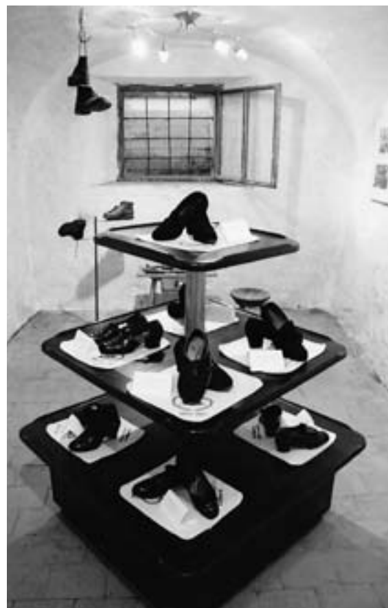
Utrinek z razstave

Vsakemu obiskovalcu pa smo v zahvalo za obisk podarili piškot v obliki salonarja.