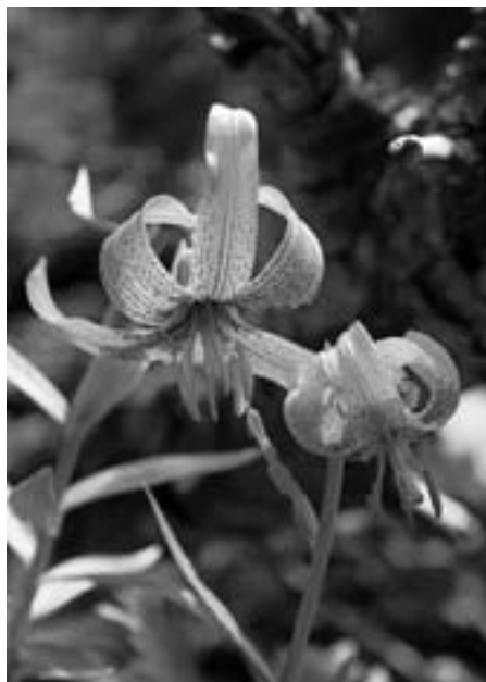
Kranjska lilija

Kot tepih zelenih pomladi na tisoče rožic cveti. Lepot in užitka nam nudiš, res krasna si, Dobrča ti.