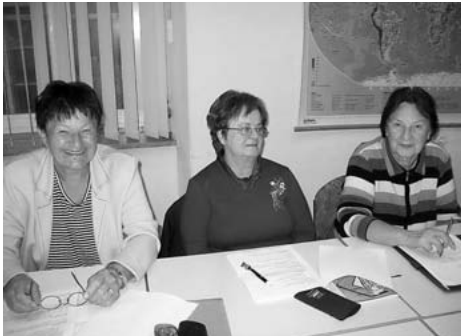
Članice Univerze za tretje življenjsko obdobje

bej pa izstopata v času, v katerem živimo. Iščemo prave resnice, čutimo potrebo po razumevanju kompleksnosti druž-