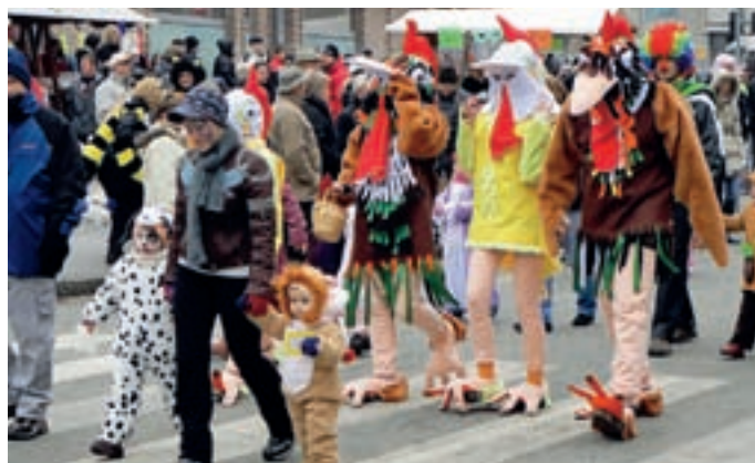
Gremo na pustni sprevod.