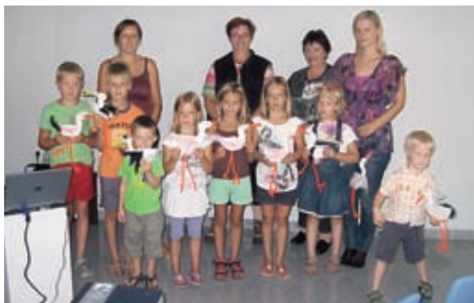
V duhu pobratenja so bili aktivni tudi otroci.