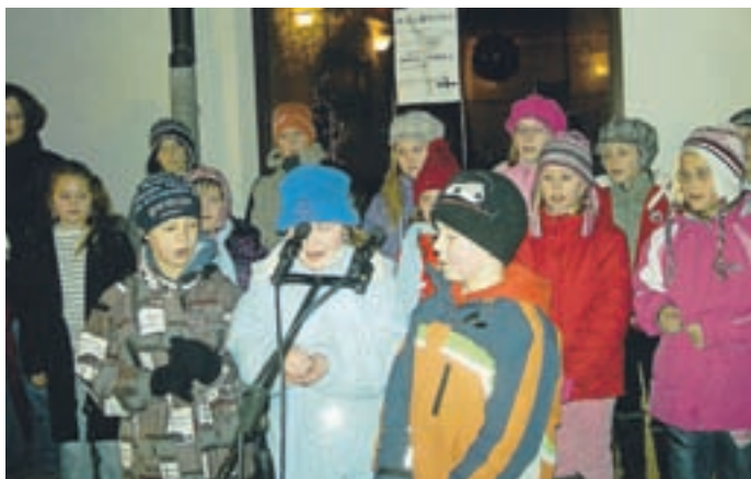
Mladi iz Loma znajo lepo peti in recitirati.