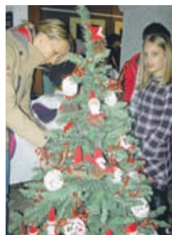
Ekipe OŠ Križe pri okraševanju