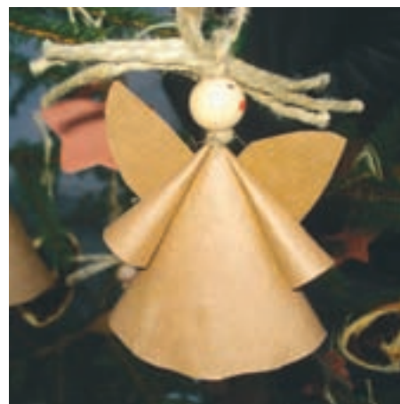
Okrasek s smrečice OŠ Križe