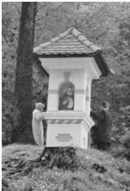
Francosko znamenje na Brežcah

Zmagoslavni pohodi Napoleona so usahnili, pregnan je bil 1812. iz Moskve in nazadnje poražen 16. do 19. oktobra 1813 pri Lipskem v Nemčiji. Avstrijski general Hiller je imel glavni stan v Celovcu. Dne, 20. avgusta 1813 je ukazal 20 mitničarjem, naj zasedejo Ljubelj. Francozi so poslali poldrugo kompanijo - stotnijo vojakov na Ljubelj, ki je pregnala mitničarje brez strela. A glej, že 26. avgusta 1813 ob 18. uri je prišlo pol stotnije avstrijskih strelcev v Tržič. Veliko domačinov jim je prineslo kruha, jedi in vina. Iz Jabornikove hiše je zagrmel glas nadstrelca: "Poberite se vi francoski privrženci, sicer ukažem streljati na vas!" Kakor bi pihnil, se je izgubila množica radovednežev. Čez dva dni je prijahalo osem francoskih žandarjev na konjih in jezdilo do rotarske kajže pod Sv. Ano. Avstrijski strelci bi jih lahko ujeli, a so jih le obmetavali z blatom in taki so divjali skozi Tržič. Takoj so straže le-ti postavili na Pristavi. V Holzapfelovi hiši (trg 28) je bilo skladišče hrane za stražarje. Iz Pristave so zjutraj prišli francoski stražarji v skladišče po hrano in rekli: "Tržičani ste avstrijski privrženci!" Popoldne okoli 15. ure so prišli avstrijski strelci v skladišče in pri odhodu dejali! "Tržičani držite z Francozi!" Tako je bilo osem dni. V tem času je prišlo šest avstrijskih ulancev in