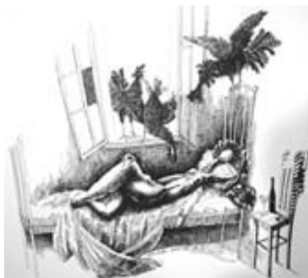
Veno Dolenc: Strasti in odpuščanja