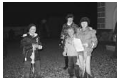
Pred cerkvijo v Križah: mi smo vidni, kaj pa vi?

je mnogokrat prekratka razdalja za varno zaustavitev vozila. Če je megla, je stanje še nekajkrat bolj katastrofalno. Prvošolčke smo s kresničkami obdarili že ob pričetku šolskega leta, osnovnošolskim otrokom je omogočeno sodelovanje v republiški akciji BODI preVIDEN , pred kratkim pa smo predstavniki SPV obiskali štiri cerkve v občini (Kovor, Tržič, Križe, Bistrica), kjer je pomočnik komandirja za področje prometa PP Tržič udeležencem večernih maš nazorno predstavil pomen nošenja odsevnih teles, vsem pa je bil podeljen tudi odsevni trak z zloženko BODI preVIDEN . Razdeljenih je bilo prek petsto odsevnih trakov, ki sta jih za akcijo prispevala SPV Občine Tržič in Policijska postaja Tržič. Nasvet članov SPV Občine Tržič je več kot jasan: PEŠCI - uporabljajte odsevne predmete, po cesti, kjer ni pločnika, hodite po levi strani in aktivno