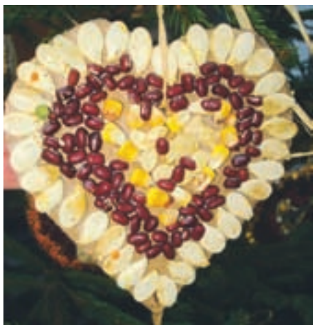
Okrasek s smrečice POŠ Podljubelj