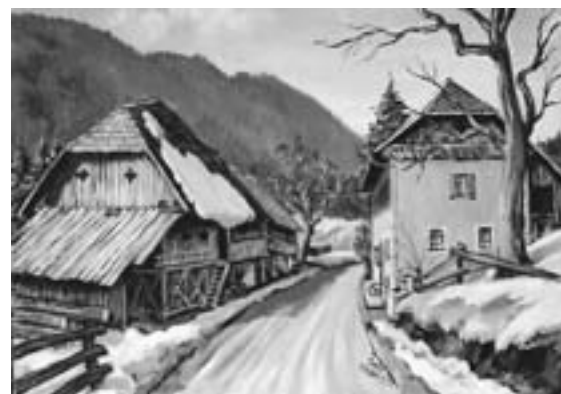
Sokličeva domačija v Lomu, akvarel