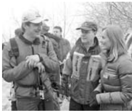
Tržiške pohodnike pričakala tudi notranja ministrica Katarina Kresal.

Pohod tržiških pohodnikov v Dražgoše postaja že tradicionalen ponovoletni dogodek. Letos se nas je zbralo že več kot sto. Povezujejo nas druženje, skrb za zdravje in pozitiven odnos do preteklosti.