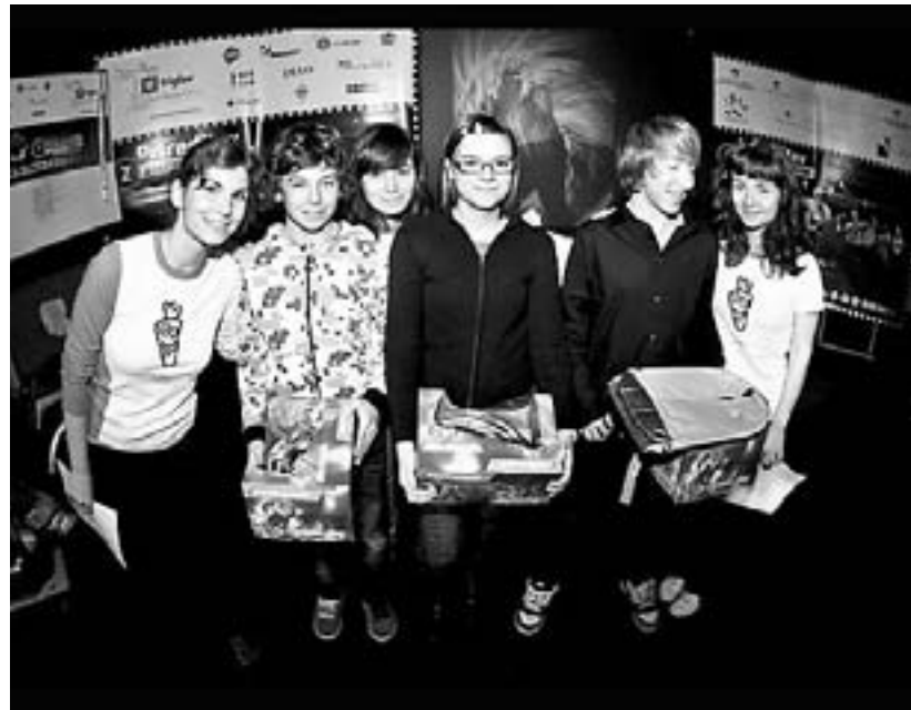
Nagrade za tiste z najkrajšim reakcijskim časom pri stiskanju zavore