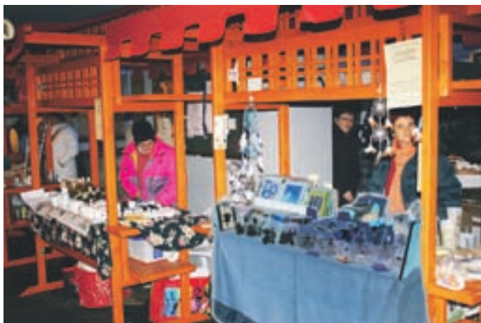
Pestra ponudba prazničnih stojnic