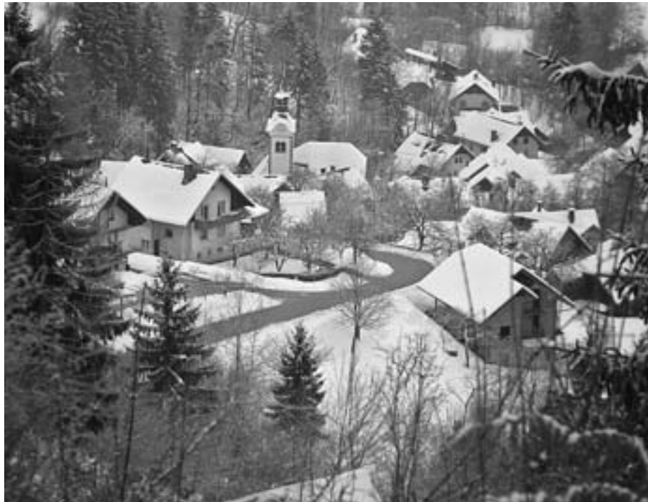
Leše v snegu

mater, prvič za 1. maj doživeli budnico s strani tržiškega pihalnega orkestra, poslušali koncert pevskih zborov in ob koncu leta s prireditvijo Imamo vas radi razveselili starejše. Obiskali smo pobratene Lešane na Koroškem in se povzpeli na Uršljo goro, odšli na martinovanje v Vitanje in vmes skočili še k prijateljem v Breginj. Zaključili smo notranjost poslovilne vežice ter poskrbeli za obnovo stavbe, v kateri se nahaja. Pri šoli smo za namene prireditve zgradili nadstrešek. Občina Tržič