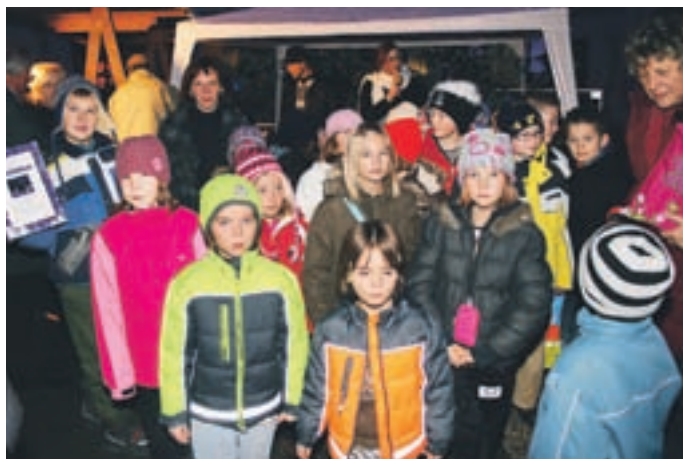
Okraševalci smrečice POŠ Podljubelj