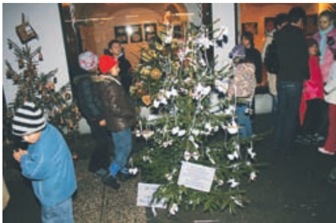
Smrečica POŠ Lom