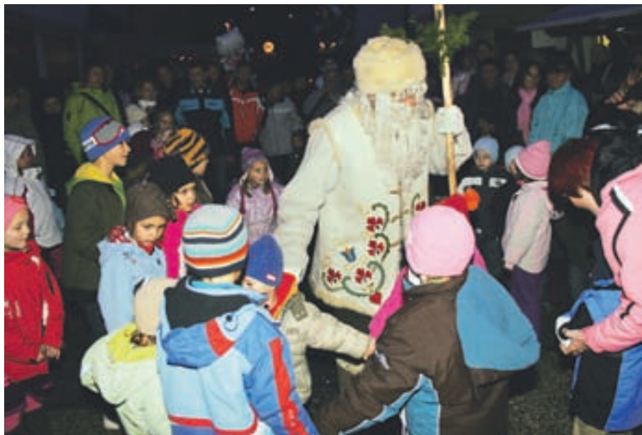
Prihod dedka Mraza

Prošnji za obdaritev otrok so se odzvali in prispevali: Cores, d. o. o., Kranj, Lipica turizem, d. o. o., Državna založba Slovenije, d. d., Pomorski in tehniški izobraževalni center Portorož v sodelovanju z Akvarijem Piran, Spar, d. d., Območna obrtna zbornica Tržič, Alpe Adria Media marketing, d. o. o., Prirodoslovni muzej Slovenije, Office1 Superstore Tržič, Turizem Kras, d. d. - Postojnska jama, Park Škocjanske jame, Slovensko mladinsko gledališče Ljubljana, Vodni park Bohinj, Tehniški muzej Slovenije v Bistri, Gorenjska banka, d. d., Optika Aleksandra Tržič, Rokavičarstvo Križaj - Simona Zupan s.p., Lekar na Deteljica in Pošta Slovenije, d. d.