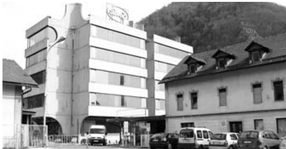
Rušitev opuščene Pekove upravne stavbe

Podatki iz premoženjske bilance Občine Tržič