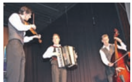
Nasmejani godci KUD Triglav, Slovenski Javornik

ker se trudi, da bi bilo znanje dostopno vsem, ki bi v življenju radi dosegli kaj več. Še posebej v današnjih negotovih časih je nujno, da se človek ves čas izobražuje, saj ima z več znanja tudi več možnosti ne le za dostojno preživetje, ampak tudi za to, da bo v poklicu uspešen in zadovoljen. Zadovoljstvo v poklicu pa bo s podaljševanjem delovne dobe, ki se nam obeta, vedno večja vrednota.