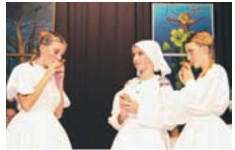
Članice KD Folklorne skupine Karavanke

administratorje in ekonomske ter komercialne tehnike. V teh letih sem na Ljudski univerzi srečala ogromno zelo različnih ljudi z različnimi življenjskimi usodami. Marsikomu je po daljši prekinitvi težko znova sestiti v šolske klopi, nekateri niti nimajo prav lepih spominov na leta rednega šolanja. A po mojih izkušnjah skorajda vsi, ki se resno lotijo dela, uspešno opravijo zaključni izpit ali poklicno maturo, najuspešnejši se celo odločijo za študij na katerem od visokošolskih strokovnih programov. Vsak človek ima (ali bi vsaj moral imeti) pravico do izobrazbe. Ljudska univerza v Trzinu je za ožje in širše okolje kot ustanova pomembna prav zato,