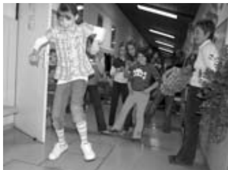
Ristanc je zelo zabavna igra.

V četrtek, 23. aprila 2009, smo na naši šoli spet pripravili delavnice v okviru 150. obletnice Osnovne šole Križe. Tokrat so zanje poskrbel učenci prve triade. Učenci prvih razredov so prikazali, kako so se otroci včasih kratkočasili z ristancom. Zaplesali so otroški ples Potujemo v Rakitnico, se igrali igri trden most in gnilo jajce. Drugošolci so prikazali frnikoljanje in spuščanje milnih mehurčkov. Zaplesali so ples Abraham 'ma sedem sinov in vas povabili, da se z njimi igrate staro družabno igro domino. Tretješolci so vas povabili k igranju špane. Starejše učence so navdušili z igro rihtarja bit'. Nekateri so ponovno preizkusil svoje spretnosti pri igranju z vrvice. Ura, namenjena igram, je hitro minila. Marsikateri obiskovalec se je za trenutek vrnil nazaj v svoje otroštvo. Oživel so