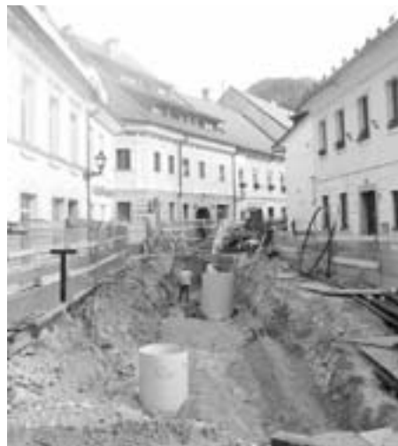
Dela na Trgu svobode

Poleti se je v Tržiču veliko dogajalo in za vse okuse in vsakogar se je nekaj lahko našlo. Poletne prireditve so bile dobro sprejete in obiskane. Na njih so se nam predstavili številni domačini, v gosteh pa smo imeli kar nekaj uveljavljenih imen slovenske estrade - Perpetuum Jazzile, Big foot Mama, Modrijani, Hišni ansambel Avsenik, Špas teater ... Po številu razstavljalcev in obiskovalcev je bila rekordna tudi Šušarska nedelja, zato čestitke organizatorju, Turističnemu društvu Tržič. Pohvale vsem tržiškemu društvu, gostincem in posameznikom, ki so se znali dobro organizirati in so priložnost izkoristili za to, da so zaslužili kakšen dodaten evro.