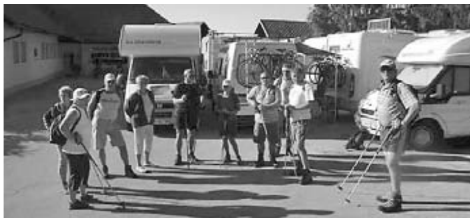
Dan za pot v hribe je bil čudovit.