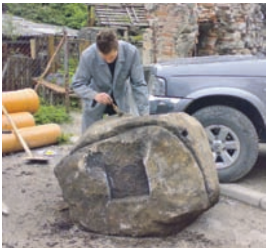
Posnetek primarnega konservatorskega posega na ostanku prepihalnega kurišča

Pri izvedbi prenove komunalne infrastrukture so komunalni delavci na delovišču (lokacija fužinarske in muzejske ulice naleteli na zanimivo najdbo - ostanke volčjih pretaljevalnih peči in prepihalnih kurišč za proizvodnjo grodlja (surovega železa) in njegovo sekundarno predelavo v črnjavo, nekdanje mogočne Globočnikove fužine. Med natančnim pregledom najdb sem naletel tudi na večjo količino silikatne žlindre (stranski produkt pri pretaljevanju železove rude).