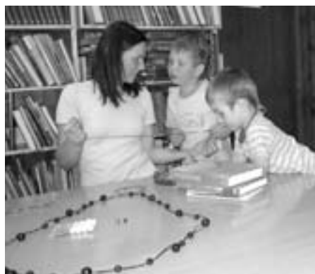
Na delavnici Moja nova ogrlica

bro izpolnjuje svoje poslanstvo. Namen je namreč v širjenju in razvijanju zamisli in prakse vseživljenjskega učenja. Nikoli namreč ni pozno, da se človek ne bi lotil npr. brskanja po internetu. In niti za to, da bi spoznal, da je to pravzaprav zelo uporabna in koristna stvar. V knjižnici se že pripravljamo na TVU 2010.