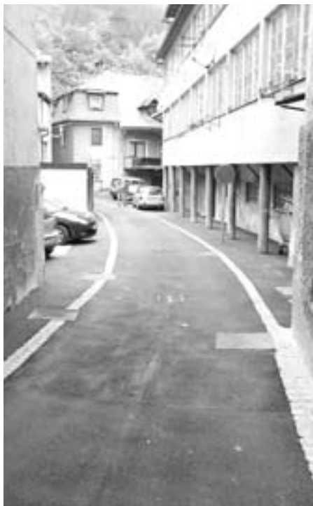
Dela so zaključena tudi v Čevljarski ulici.

Že dobro leto po ulicah starega mestnega jedra Tržiča potekajo intenzivna obnovitvena dela na komunalni opremi. Tržičani bomo pridobili privlačne in urejene ulice starega mestnega jedra in precejšnje število prepotrebnih parkirnih mest. Obnovitvena dela so zaključena v ulicah Za Mošenikom, Prehod, v Usnjarski ter Čevljarski ulici, kjer so obnovljeni vsi komunalni vodi, položen je nov asfalt in urejenih 48 novih parkirnih prostorov. Obnovili smo oporni zid ob Mošeniku, ki je bil v izredno slabem stanju in ga brez sanacije ni bilo možno nadvišati z opečno ograjo. Trenutno se pospešeno izvajajo dela v Fužinski in Muzejski ulici, ocenjujemo, da bodo zaključena v roku, do 30. junija 2009. Pri tem je potrebno omeniti, da se prenova ob stari pekariji in v Fužinski ulici ne bi mogla izvesti brez sodelovanja tamkajšnjih lastnikov zemljišč, ki so nam omogočili dostop do gradbišč prek njihovih zemljišč - v imenu Občine Tržič se jim za razumevanje zahvaljujemo. Tudi v teh dveh ulicah