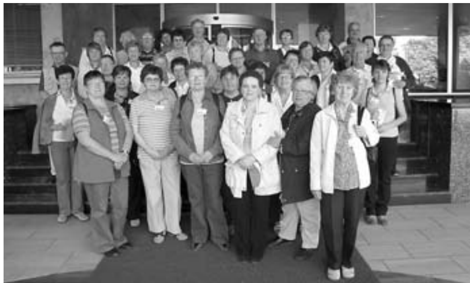
Pred upravno stavbo Krke

ustavili v upravni stavbi, kjer so nas pogostili, nato pa odpeljali v dvorano. Ogledali smo si film o zgodovini tovarne od začetkov pa do današnjega dne. Z zanimanjem smo si ogledali tudi nastajanje naj-