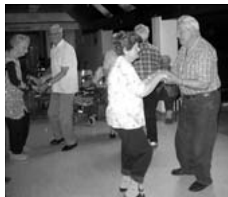
Utrinek s plesne delavnice v Domu Petra Uzarja