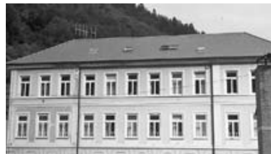
Letos obnovljena streha, prihodnje leto še fasada

izvesti, za prihodnje leto pa načrtujemo še obnovo fasade. Občina Tržič namreč sodeluje v čezmejnem projektu s sosednjo Avstrijo z naslovom "Brezmejna doživetja kulture", čigar cilj je revitalizacija nepremične kulturne dediščine in njena večja prepoznavnost. V sklopu projekta bomo v letu 2010 obnovili fasado stavbe na Balosu 4, na vhodu v Tržič bomo namestili tudi dve informacijsko-panoramski tabli z vrisanimi kulturnimi znamenitostmi mesta in kupili MP4 predvajalnike, ki bodo