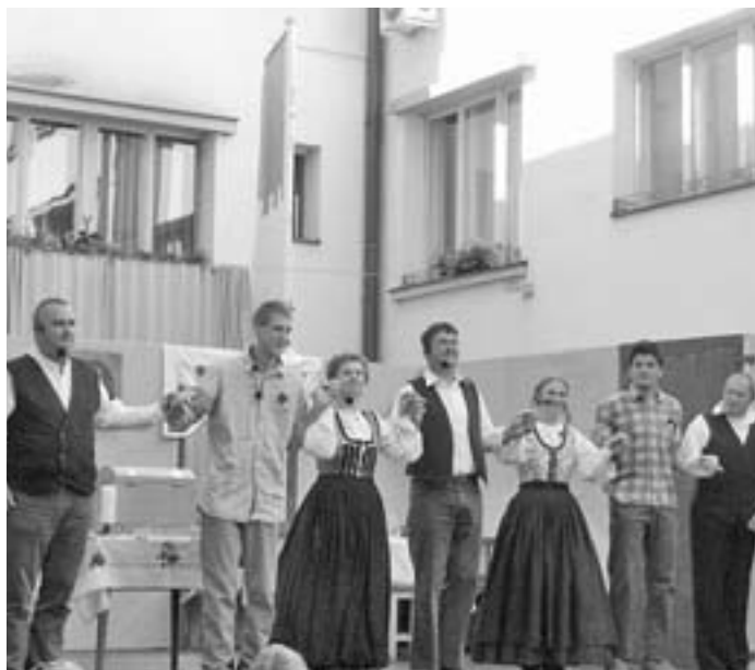
Uspešno izvedena frajšprehunga KUD-a Lom