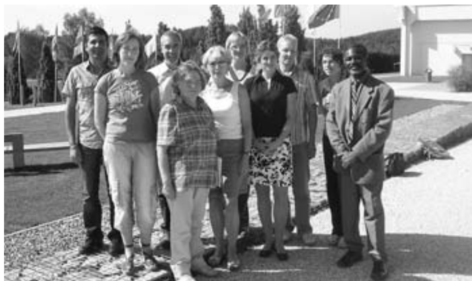
Partnerji v mednarodnem projektu Grundtvig

javnosti deli z drugimi, izkušnje drugih pa preverja v svojem okolju. Vsebinska in organizacijska nadgradnja izobraževalnih programov na mednarodni ravni, ki jo dosegamo z vključitvijo v evropski projekt