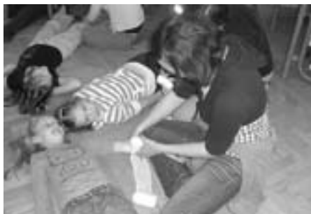
Vaja pomoči ponesrečencem

V petek pa so jih obiskali še učenci devetih razredov in v enournem skupnem druženju so povedali, kakšne poškodbe so že imeli, katere so najpogostejše in kako so ravnali ob takih trenutkih. Nato so po mešanih skupinah (devetošolci skupaj z drugošolci) vadili različne vrste pomoči ponesrečencem, povijanje telesnih delov, pomoč ob vsakdanjih nesrečah ... Čas je kar prehitro