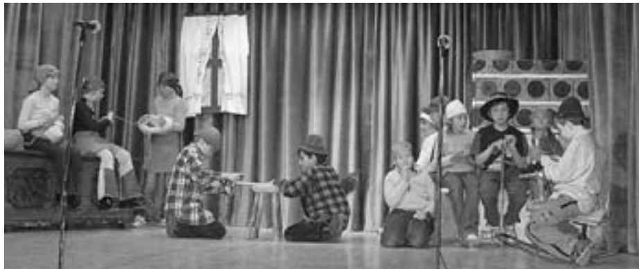
Odrska postavitve Ob krušni peči

Hitro se je obrnilo leto. Lani smo obeležili 50-letnico organiziranih podružničnih šol v Sloveniji in so nas gostili na Ledinah in v Idriji.