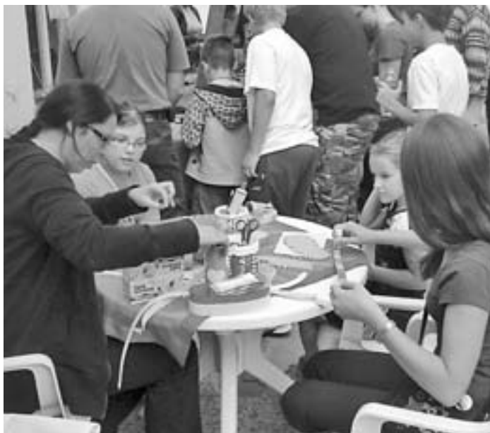
Delavnica Mladinskega centra Tržič