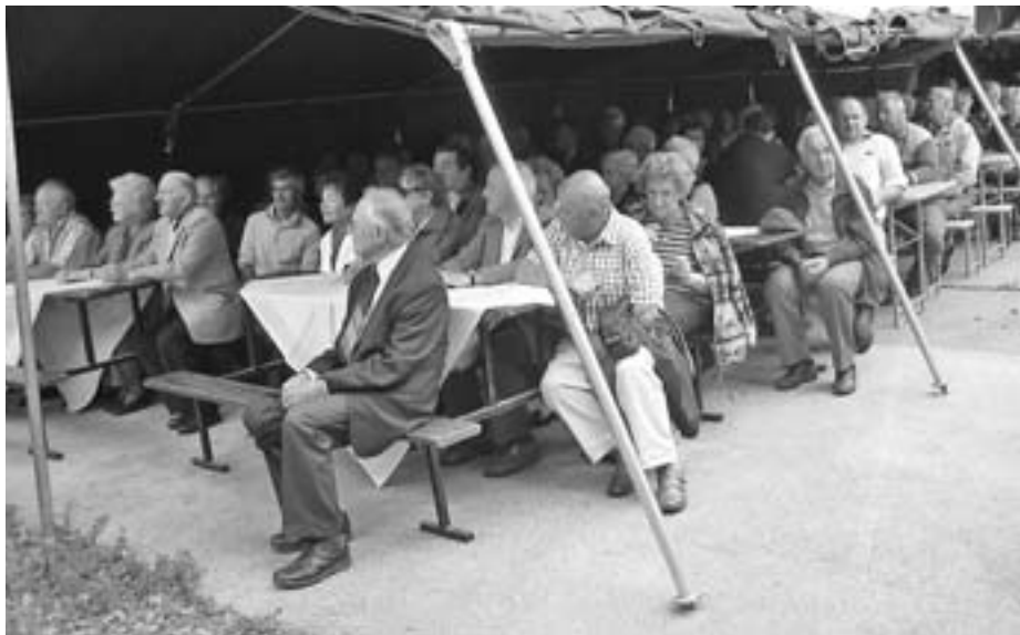
Udeleženci 9. Srečanja gorenjskih izgnancev in njihovih svojcev