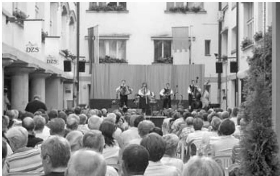
Koncerti narodnozabavne glasbe Tržiških poletnih prireditev so dobro obiskani

Vstavljanje vseh vodov sočasno in naenkrat je z gradbeno-tehničnega vidika velikokrat povsem nemogoče (izvedba jaškov, utrjevanje vodov, uskladičev terminov med posameznimi izvajalci). Najpomembnejši razlog pa je v zagotavljanju obveznih odmkov med posameznimi vodi, ščitenu že obstoječih vodov in zagotavljanju vsaj delne prevoznosti posameznih cest. Nad vodovodom praviloma ne smejo potekati drugi vodi, saj bi bila v primeru okvar popravila močno otežena. Od vodovoda se mora zato zagotoviti obvezen odmik in zato drugi vodi pridejo razporejeni čez celotno cestno telo. Če bi vse vode vstavljali sočasno, bi to torej pomenilo nekajmesečne popolne zapore cest. Če gre za ceste, kjer je mogoč obvoz ali njihova popolna zavora (npr. cesta Križe-Sebenje-Žiganja vas) in se izvajalci lahko terminsko uskladijo, potem je sočasno vstavljanje vseh vodov mogoče, drugje pa gradnja poteka v dveh, celo treh fazah (npr. Podljubelj, Bistrica).