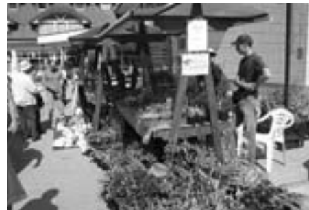
Na rokodelskem bazarju

Se vidimo na 38. razstavi Minfos 8. in 9. maja 2010 v Trziču!